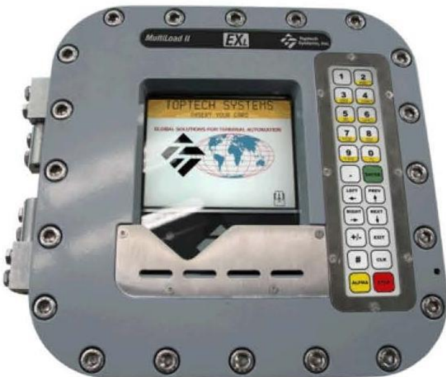
Figure 3 MultiLoad II EXL