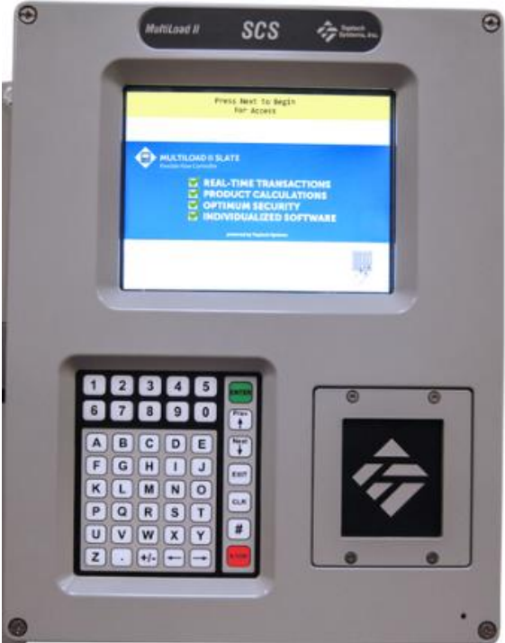
Figure 6 MultiLoad II SCS