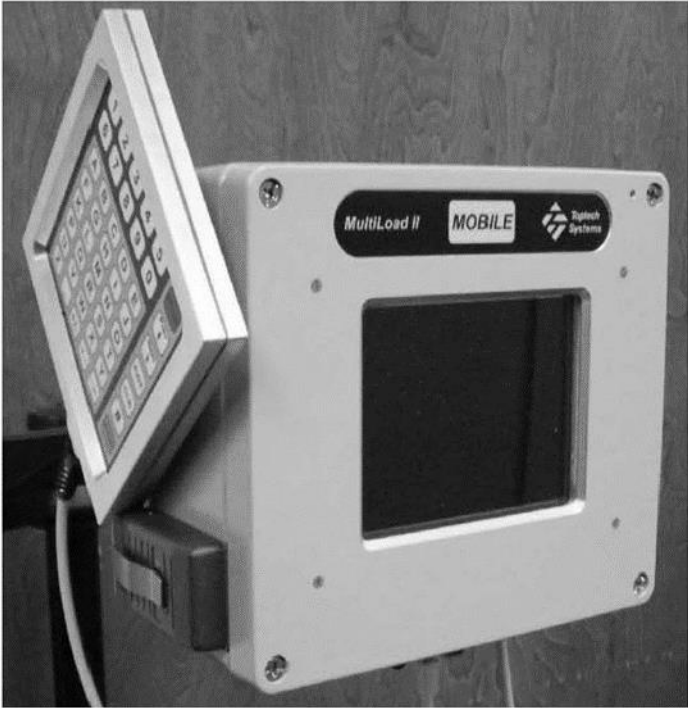
Figure 5 MultiLoad II Mobile