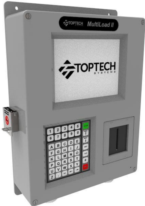
Figure 1 MultiLoad II Division 2

The following figures depict the enclosures for different models and various components: