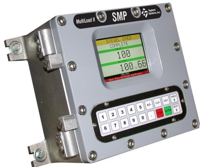
Figure 4 MultiLoad II SMP