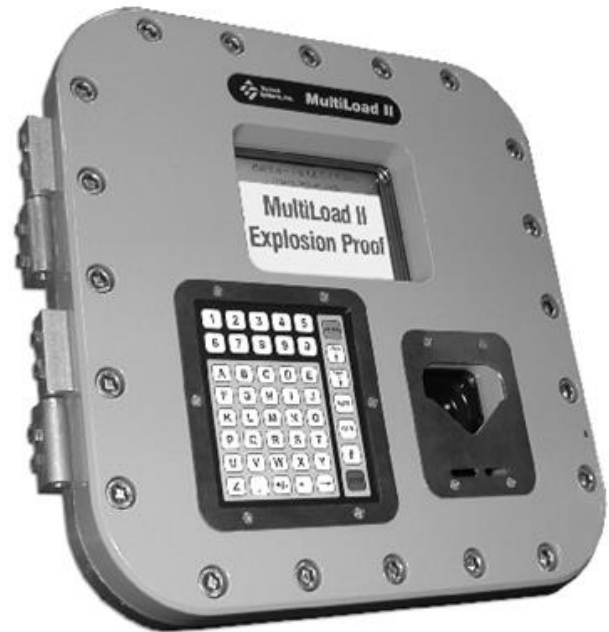
Figure 2 MultiLoad II Explosion Proof | Antidéflagrant

Les figures suivantes illustrent les boîtiers pour différentes modèles et divers composants :