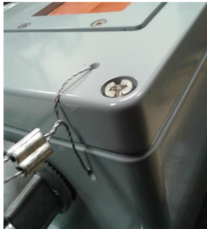
Figure 10 Seal on the enclosure (Div. 2) | le sceau sur le couvercle (Div 2)

L'interrupteur DIP no 3 est l'interrupteur du mode Program. L'interrupteur DIP no 4 est l'interrupteur du menu Weights and Measures.