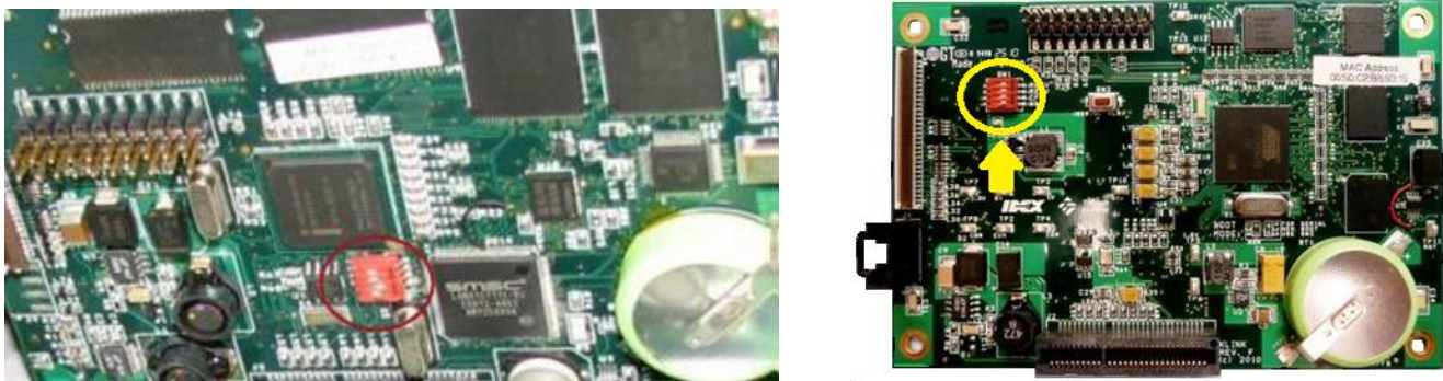
Figure 9 DIP switches for Program / W&M access; rev. 1.0 on old CPU board ( left ) and rev 2.x on new CPU board ( right ) | Interrupteurs DIP pour l'accès du mode « Program » et « W&M »; rév. 1.0 sur l'ancienne carte de CPU ( gauche ) et rév. 2.x sur la nouvelle carte CPU ( droit )