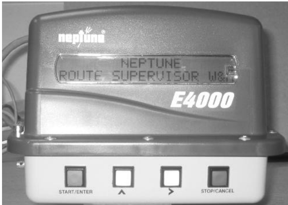
Neptune E4000 Register / Enregistreur