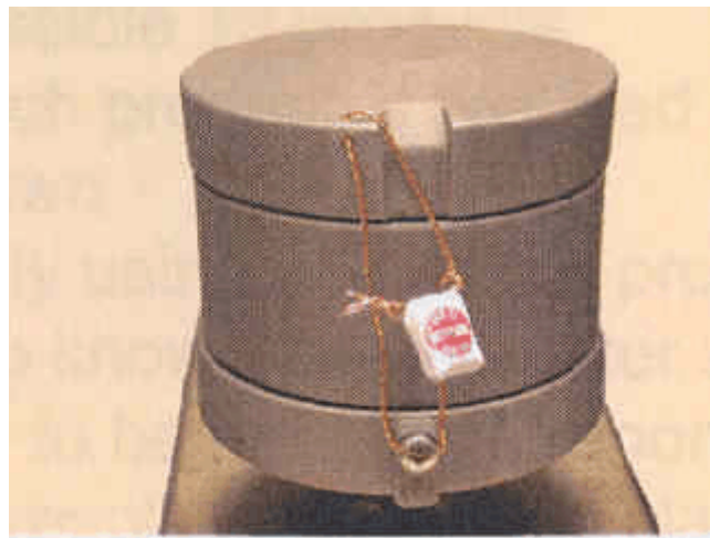
600588-000 Weights & Measures seal / Sceau de Poids & Mesures