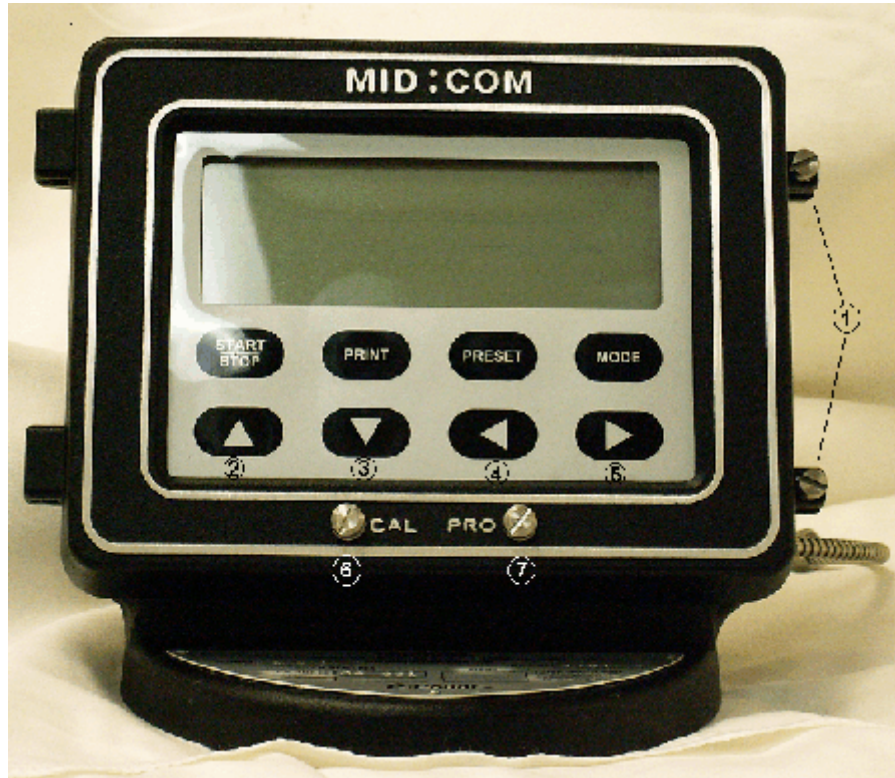
E:Count electronic register / L'enregistreur électronique E:Count