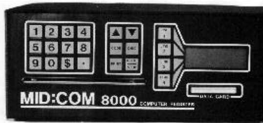
MID:COM 8000 Computer / Ordinateur MID:COM 8000