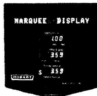
OPTIONAL DISPLAY/ Indicateur optionnel

Michel Létourneau Examineur d'approbations Tél: (613) 952-0663