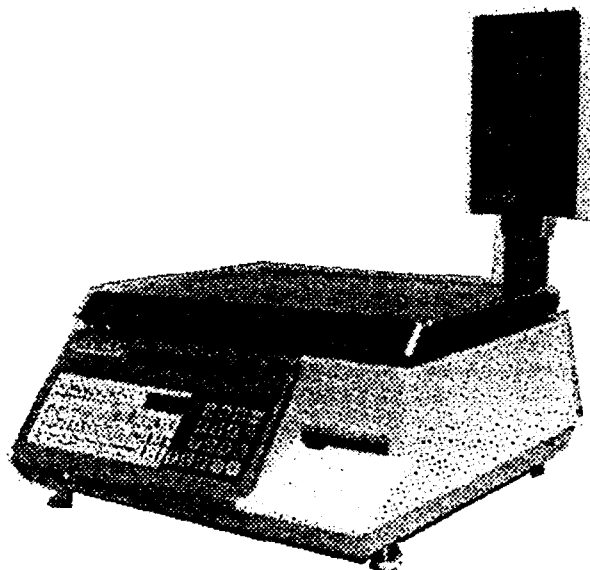
MODEL SP 80 & SP 150/ Modèle SP 80 et SP 150

Michel Létourneau Approvals Examiner Tel: (613) 952-0663