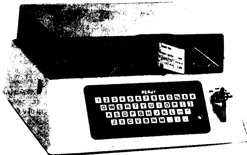
PRINTER MODEL 1140/Imprimante 1140