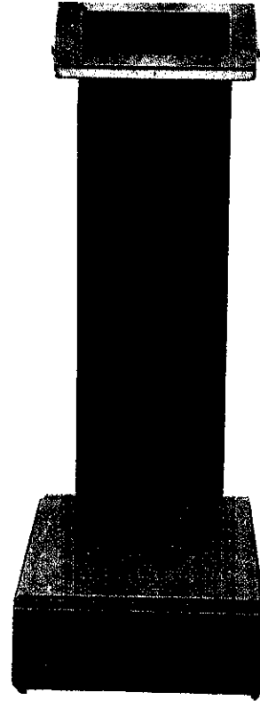
Model / Modèle 8110