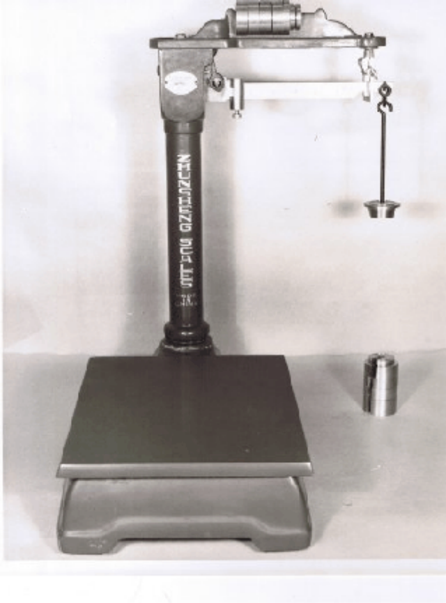
Typical model SP900 and SP901/ Modèle typique SP900 et SP901