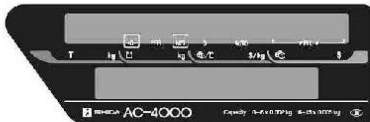
Model/ Modèle AC-4000 and/ et AC-4000B