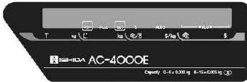
Model/ Modèle AC-4000 E