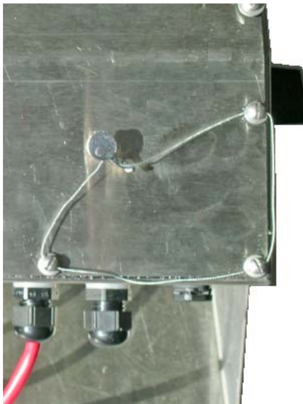
Sealing for models 720i-2A, 720i-2D and 720i-2E / Scéllage pour les modèles 720i-2A, 720i-2D et 720i-2E