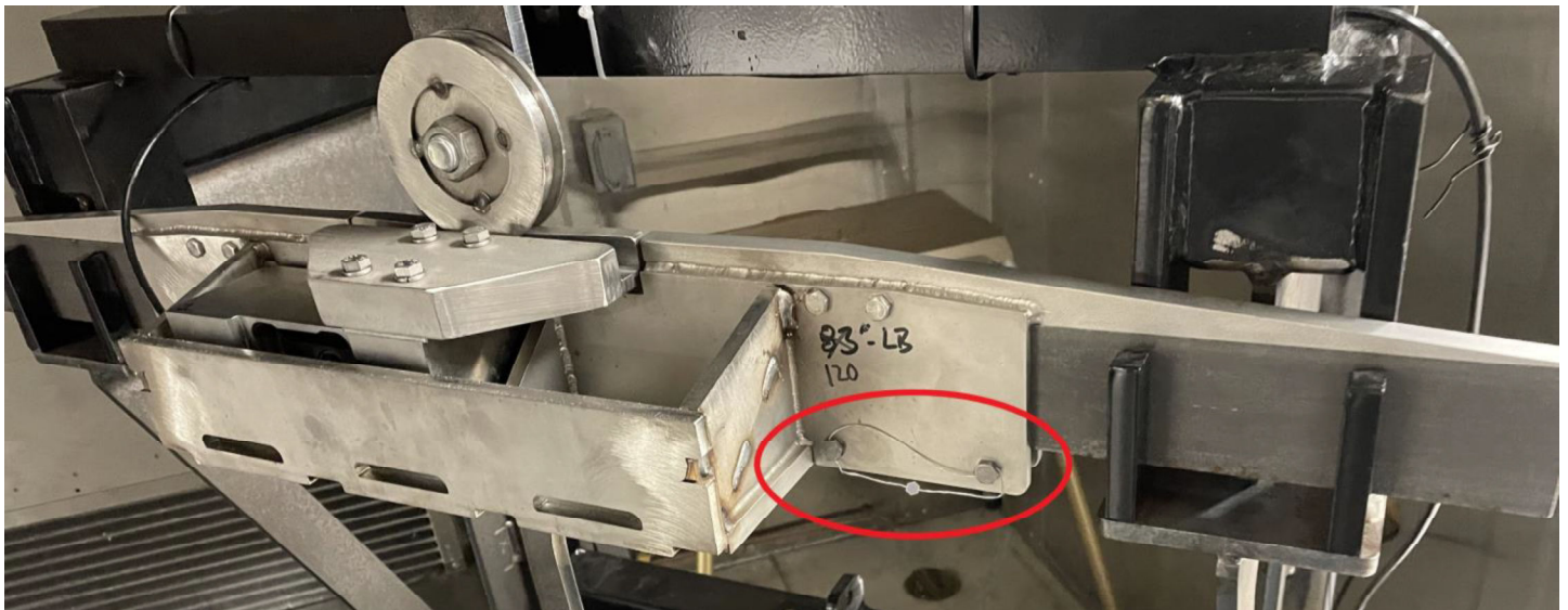
Typical Sealing of model MS200HB-SS-1/2-1500 / Scellage typique du modèle MS200HB-SS-1/2-1500