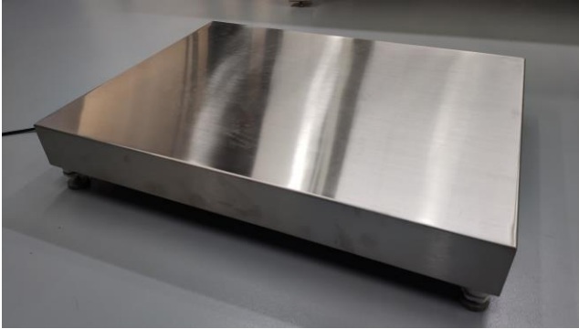
Typical Model PBD659-YYnnn / Modèle typique PBD659-YYnnn