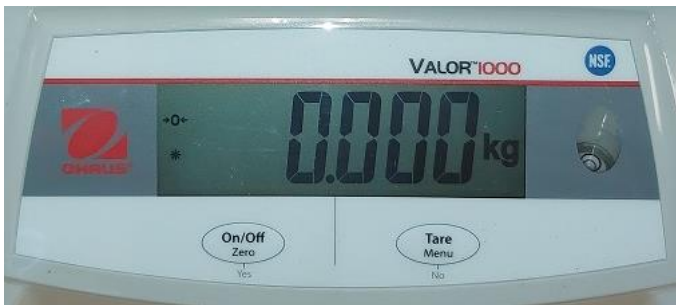
Typical display / Afficheur typique