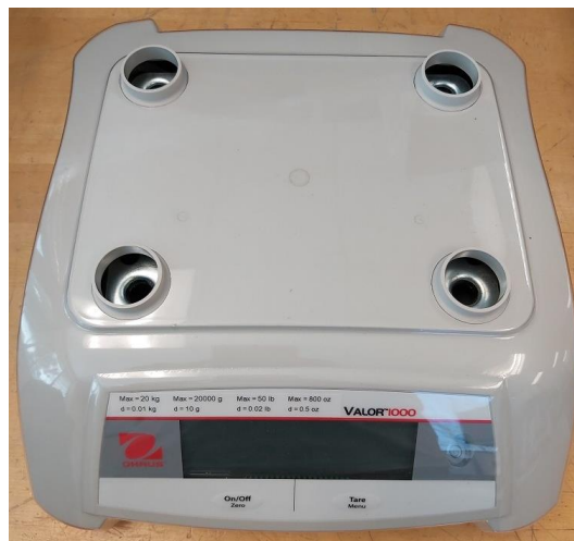
Typical Sub-platter / Sous-plateau typique