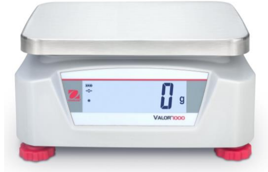
Typical Model / Modèle typique