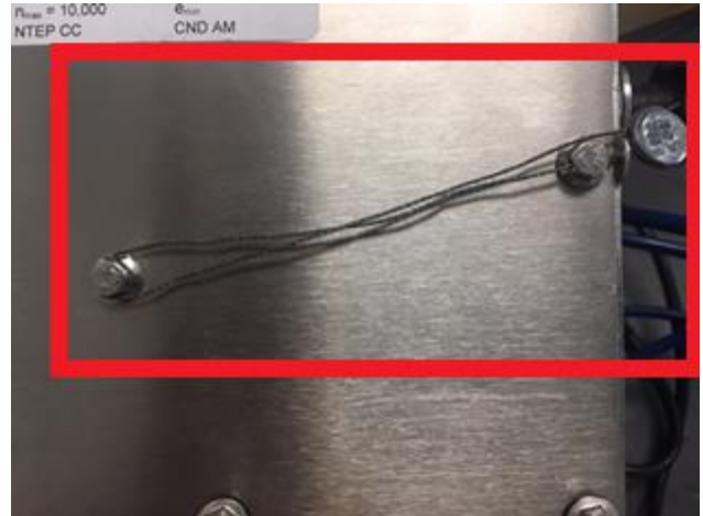
Typical Sealing for Stainless Steel Enclosure / Scellage typique pour boîtier en acier inoxydable