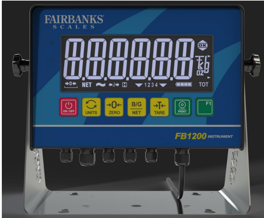
Typical Model / Modèle typique