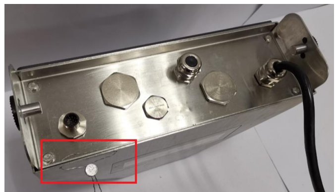
Typical i-DT61XWE Sealing / Scellage typique i-DT61XWE