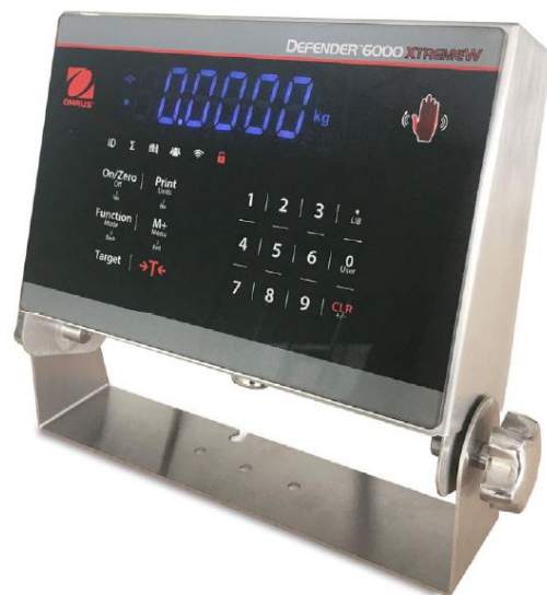
Typical i-DT61XWE Model / Modèle typique i-DT61XWE