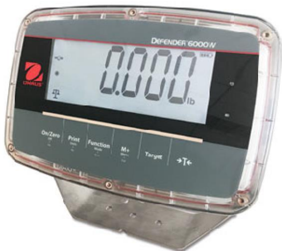
Typical i-DT61PW Model / Modèle typique i-DT61PW