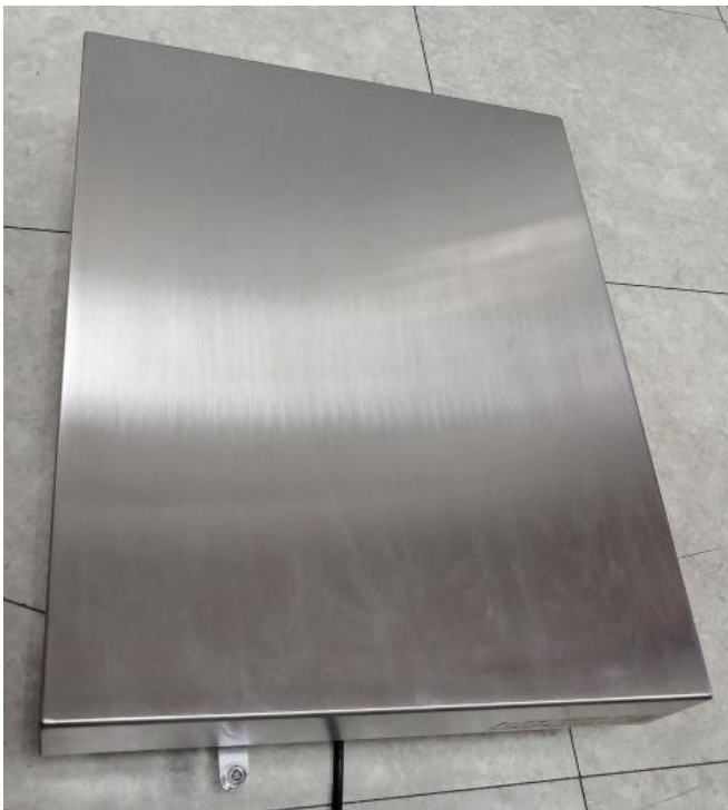
Typical device / Appareil typique