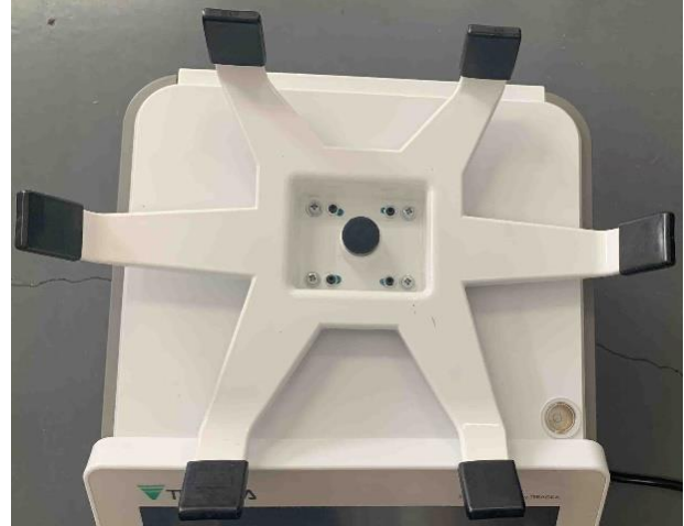
Optional sub-platter for RM-5900x / Sous-plateau optionnel pour RM-5900x