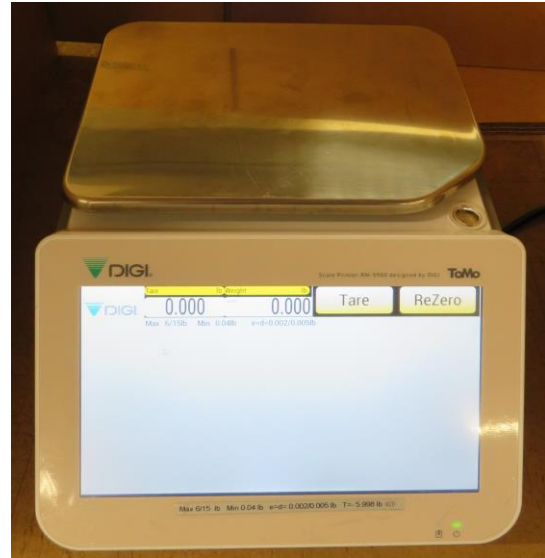
Typical RM-5900B Model / Modèle typique RM-5900B