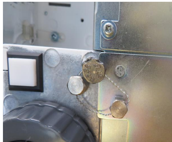
Typical Sealing for RM-5900x on the calibration switch bracket / Scellage typique pour le RM-5900x sur le support du commutateur d'étalonnage