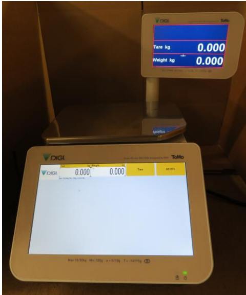
Typical RM-5900P Model / Modèle typique RM-5900P