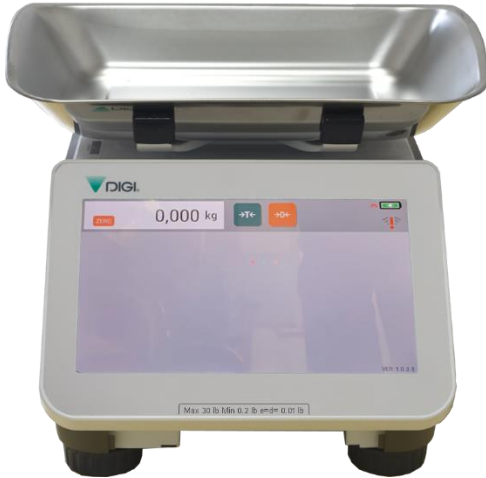
Optional platter for RM-5900x / Plateau optionnel pour RM-5900x