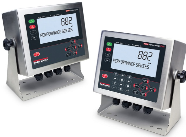
Typical Models 882IS and 882IS Plus / Modèles typique 882IS et 882IS Plus