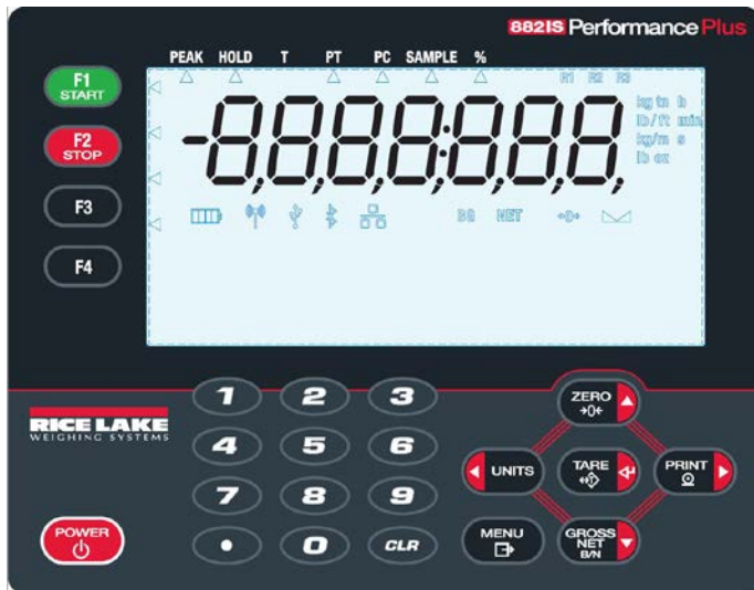
Typical Display for model 882IS Plus/ Afficheur typique pour modèle 882IS Plus