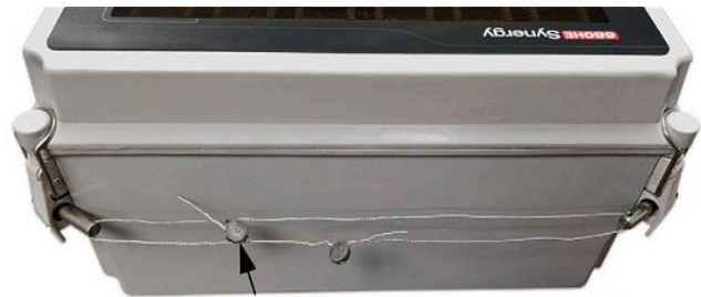
Typical sealing for model 680HE / Scellage typique pour le modèle 680HE