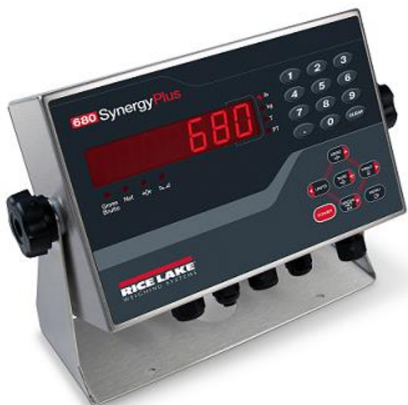
Typical Model 680 / Modèle typique 680