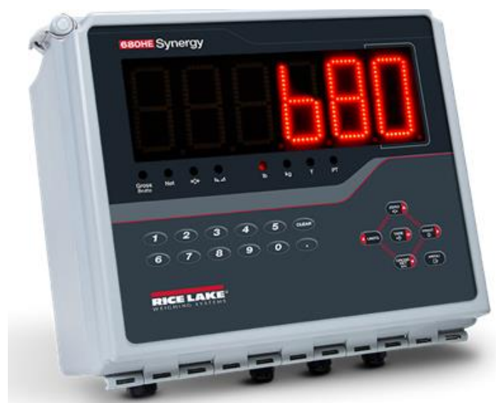
Typical Model 680HE / Modèle typique 680HE