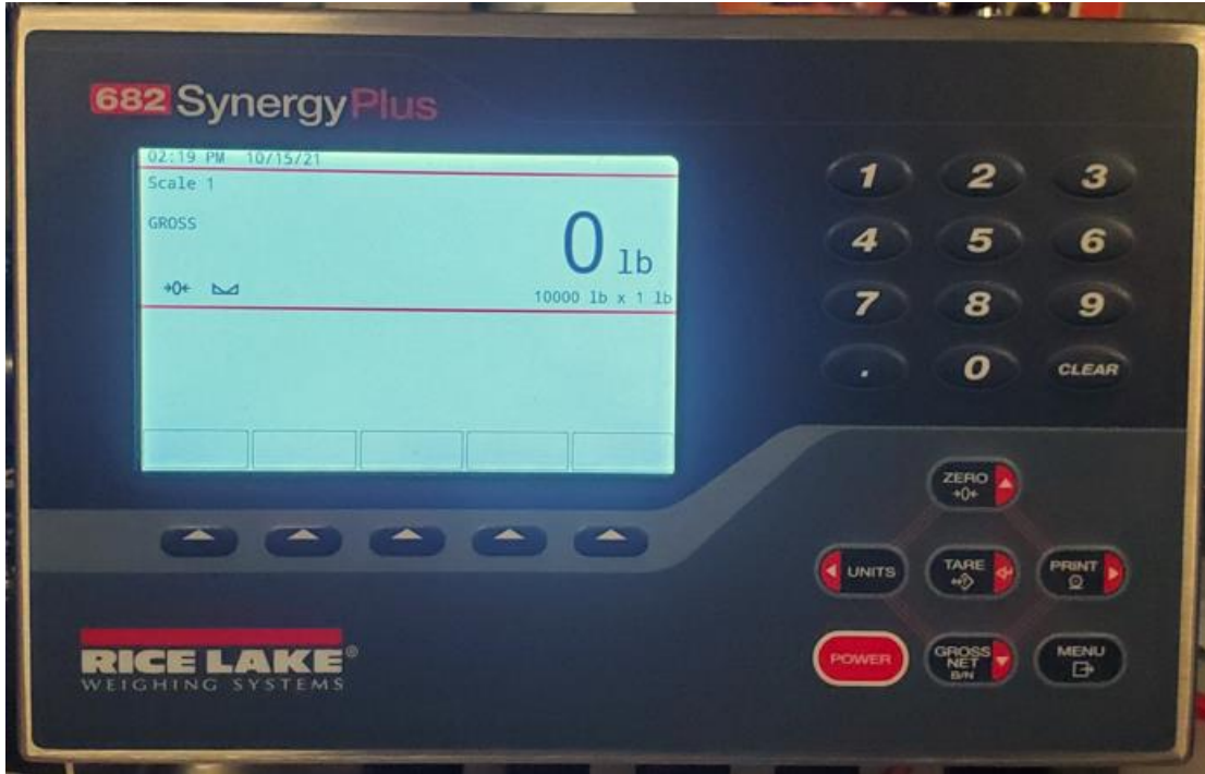
Typical Model 682 / Modèle typique 682