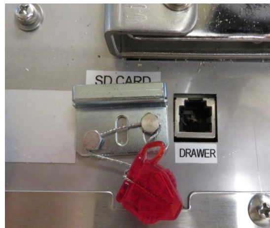
Typical sealing for SD memory card for SM-5300H/ Method typique de scellage pour l'accès à la carte mémoire SD pour SM-5300H