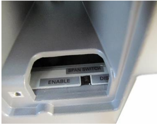
Typical calibration switch access for SM-5300SSP / Mode d'accès à l'interrupteur d'étalonnage typique pour SM-5300SSP