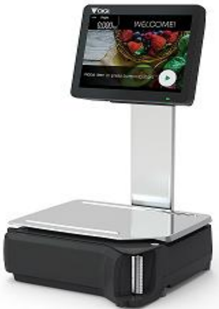
Typical Model SM-5300SSP / Modèle typique SM-5300SSP