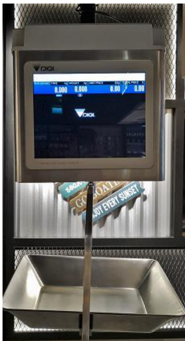
Typical Model SM-5300H / Modèle typique SM-5300H