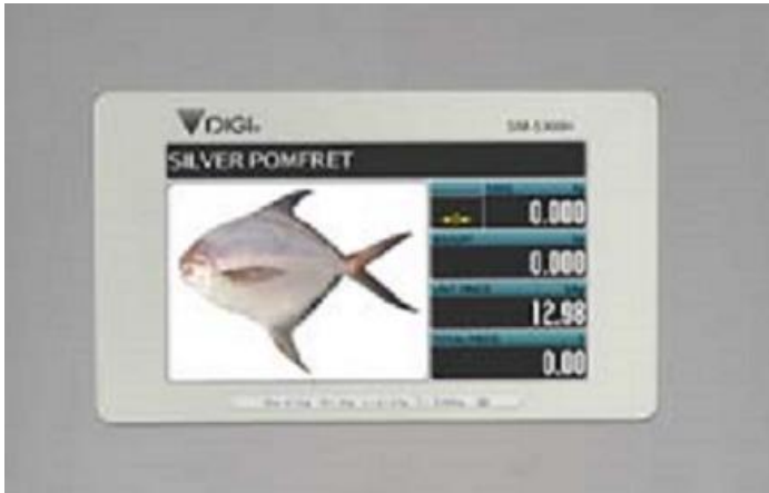
Typical customer display for SM-5300H / Affichage destiné au client typique pour SM-5300H