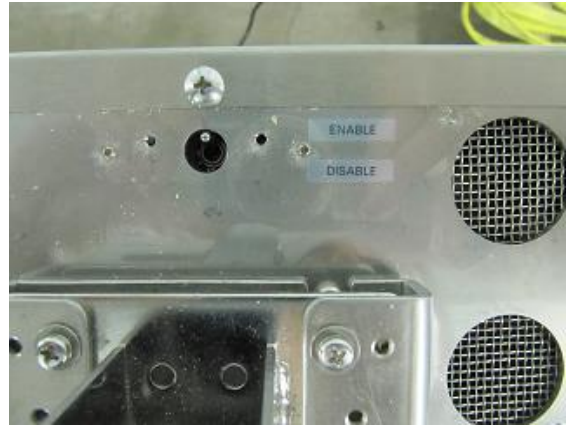
Typical calibration switch access for SM-5300H / Mode d'accès à l'interrupteur d'étalonnage typique pour SM-5300H