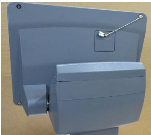
Typical sealing for SD memory card for SM-5300SSP/ Method typique de scellage pour l'accès à la carte mémoire SD pour SM-5300SSP