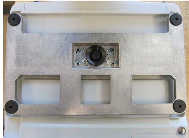
Typical Sub-platter for SM-5300SSP / Sous-plateau typique pour SM-5300SSP