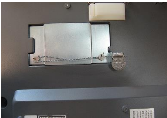
Typical Sealing for SM-5300SSP/ Scellage typique pour SM-5300SSP