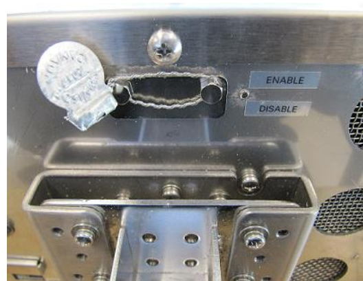
Typical Sealing for SM-5300H/ Scellage typique pour SM-5300H