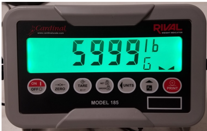
Typical Model / Modèle typique