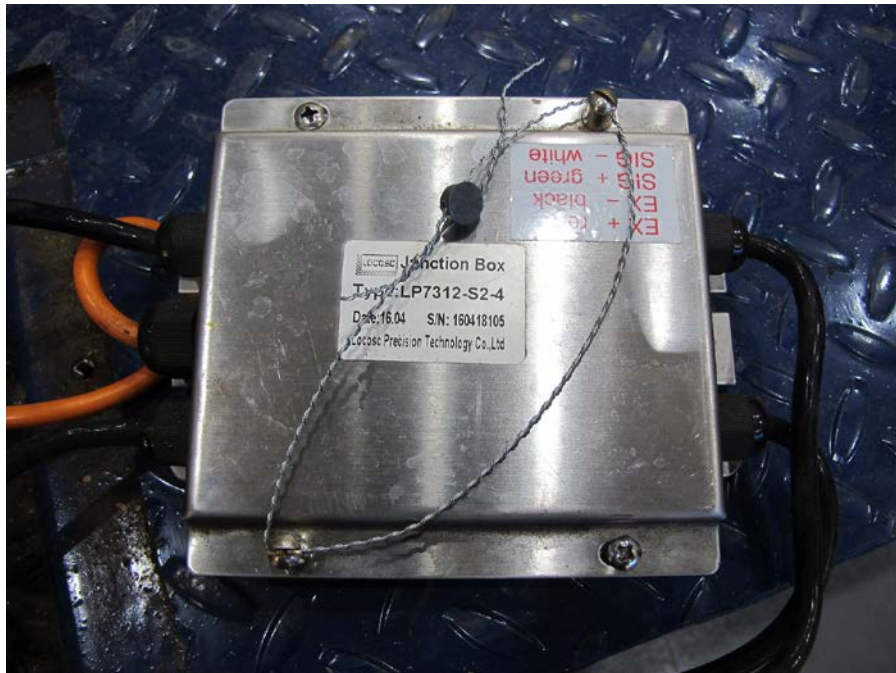
Figure 1 Typical Sealing / Scellage typique