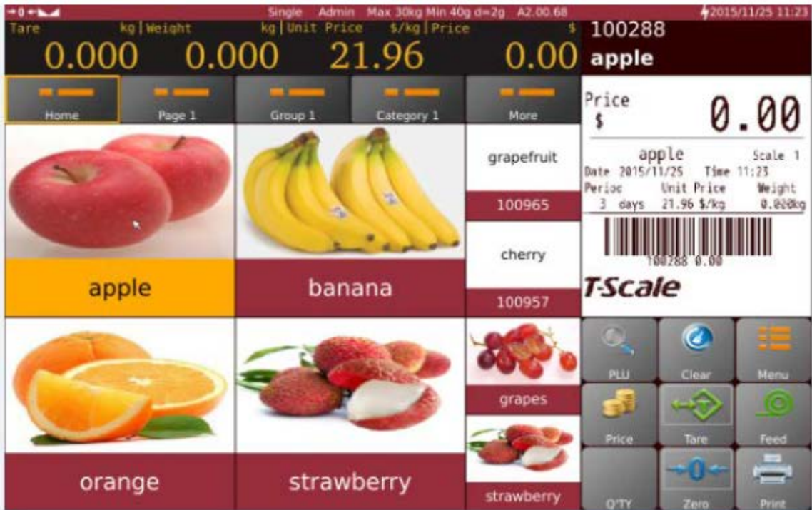
Typical operator's display / Afficheur destiné à l'opérateur typique