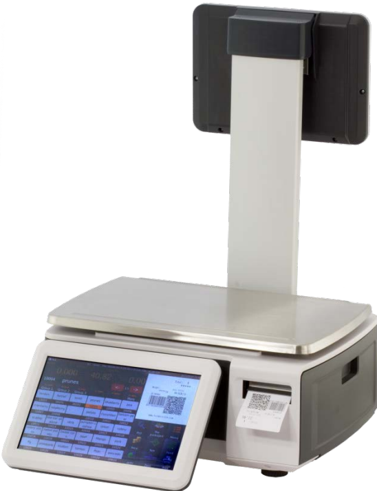
TI 30 P