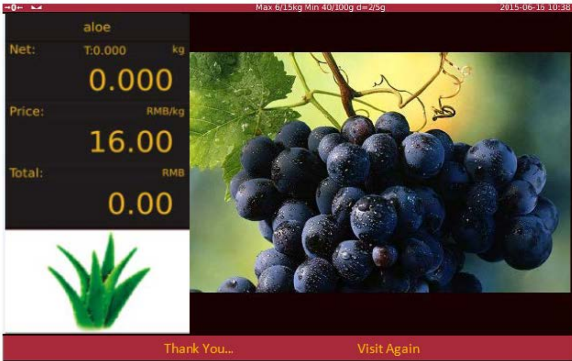
Typical customer's display / Afficheur destiné aux clients typique