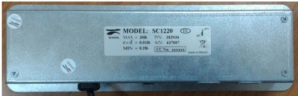
Typical Sealing of indicator/ Scellage typique de l'indicateur