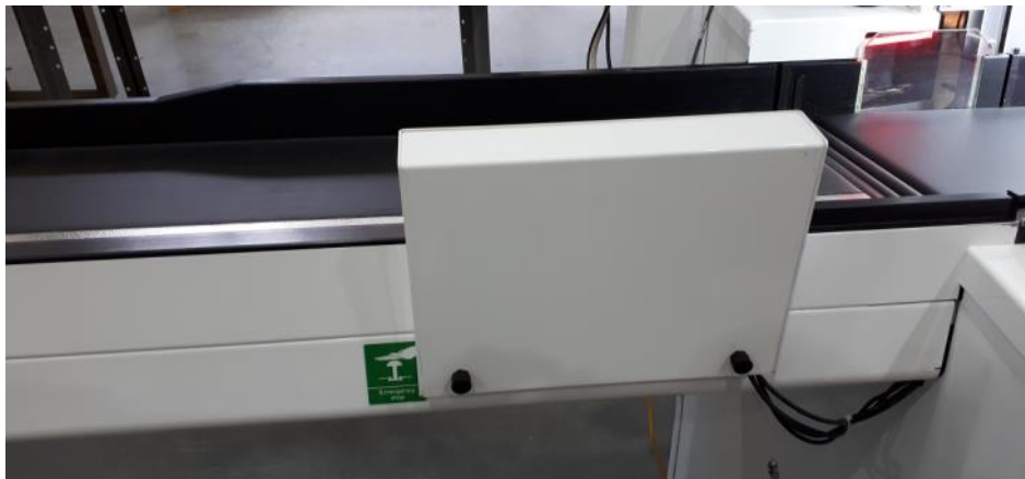
Removable cover to access indicator seals / Couvercle amovible pour accéder les scellés de l'indicateur