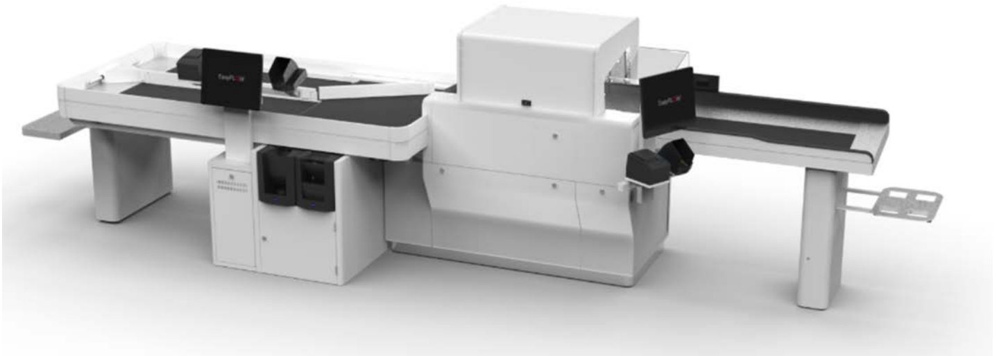
Typical EasyFLOW Model / Modèle EasyFLOW typique