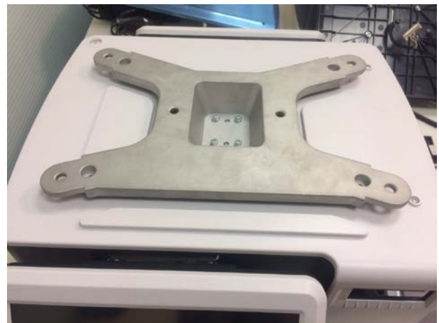
Typical Sub-platter / Sous-plateau typique