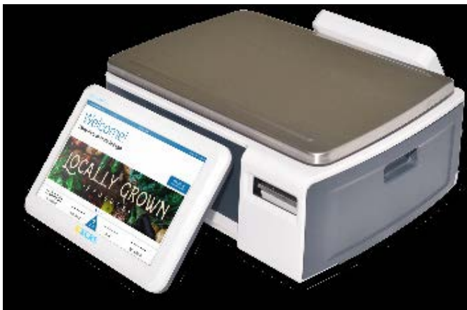
Typical Model / Modèle typique