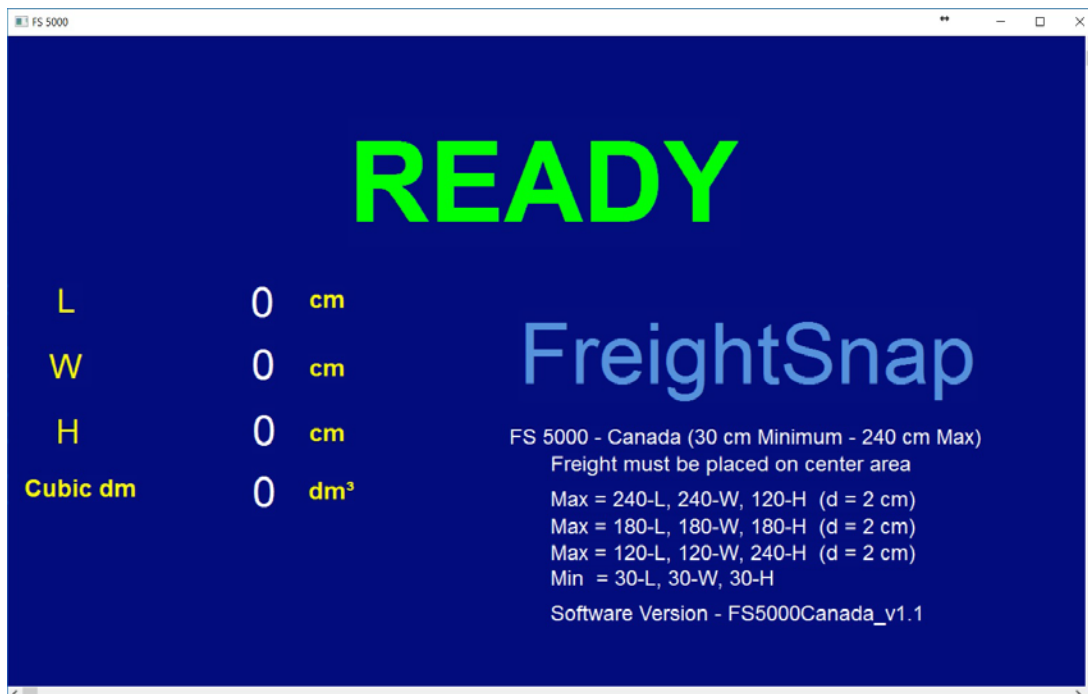
Typical display / Affichage typique