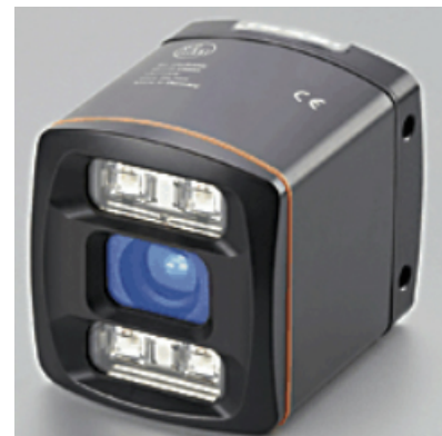
Typical sensor / Capteur typique