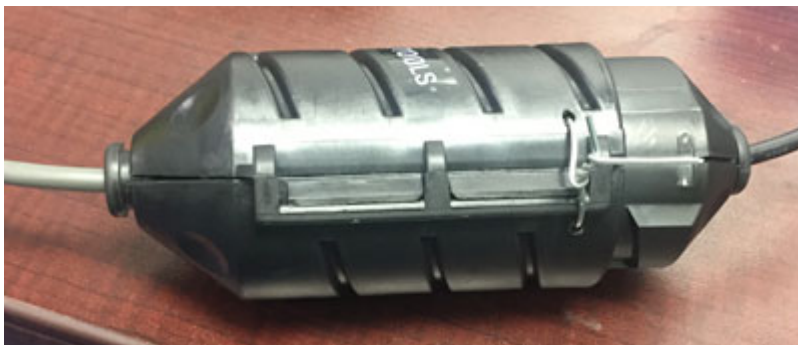
Example of sealing on bar code reader / Exemple du scellage sur le lecteur de code-barres