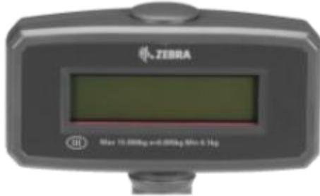
Typical Display MX-201 / Afficheur typique MX-201