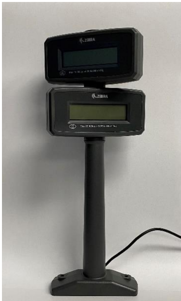
Typical Display MX-202 / Afficheur typique MX-202