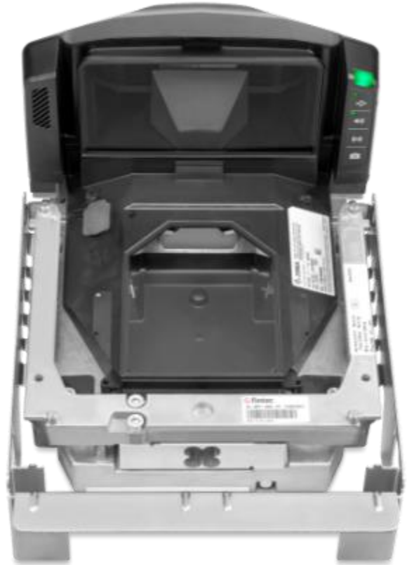
Typical Sub-platter / Sous-plateau typique