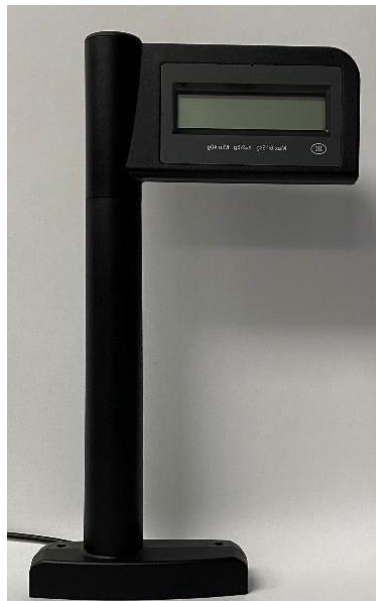
Typical Display MX-203 / Afficheur typique MX-203