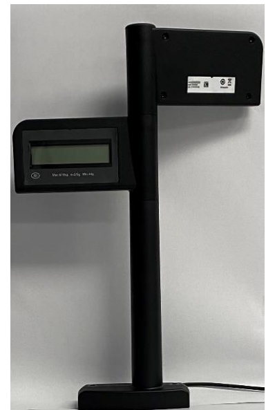
Typical Display MX-204 / Afficheur typique MX-204