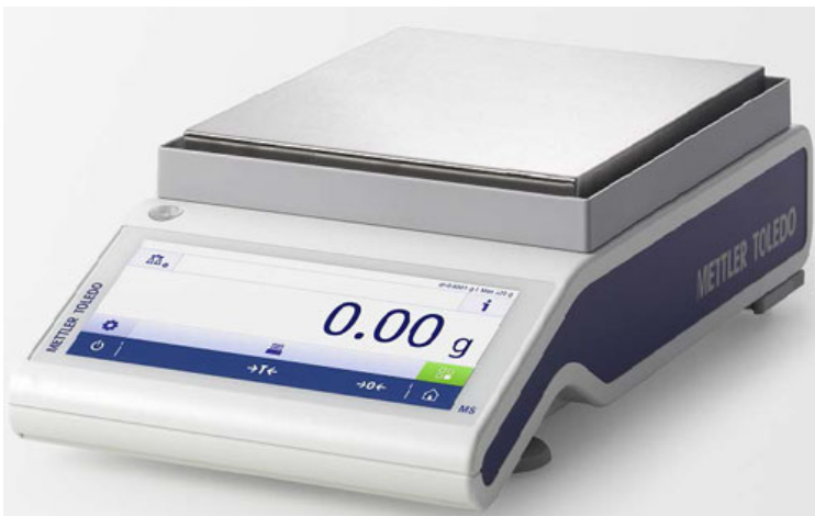
Typical model MS1602TS/A, MS3002TS/A, MS4002TS/A, MS4002TSDR/A, MS6002TS/A, MS6002TSDR/A, MS12002TS/A or MS8001TS/A / Modèle MS1602TS/A, MS3002TS/A, MS4002TS/A, MS4002TSDR/A, MS6002TS/A, MS6002TSDR/A, MS12002TS/A ou MS8001TS/A typique