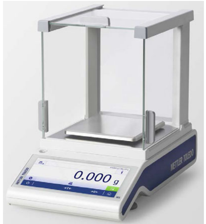
Typical model MS303TS/A, MS403TS/A, MS603TS/A or MS1003TS/A / Modèle MS303TS/A, MS403TS/A, MS603TS/A ou MS1003TS/A typique