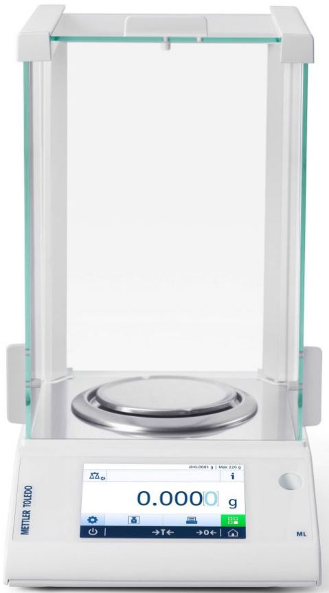
Typical model ML54T/A, ML104T/A, ML204T/A or ML304T/A / Modèle ML54T/A, ML104T/A, ML204T/A ou ML304T/A typique