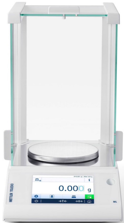
Typical model ML203T/A, ML303T/A or ML503T/A / Modèle ML203T/A, ML303T/A ou ML503T/A typique