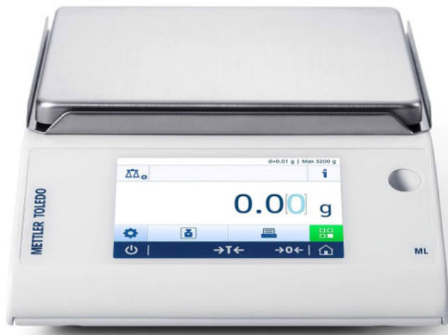
Typical model ML802T/A, ML1602T/A, ML3002T/A, ML4002T/A, ML6002T/A, ML3001T/A or ML6001T/A / Modèle ML802T/A, ML1602T/A, ML3002T/A, ML4002T/A, ML6002T/A, ML3001T/A ou ML6001T/A typique