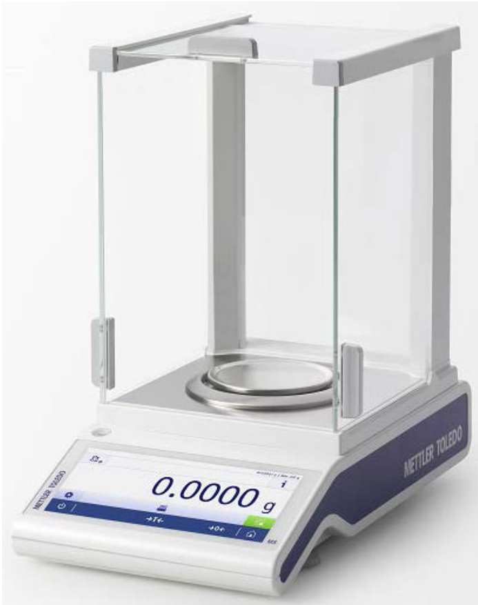
Typical model MS104TS/A or MS204TS/A / Modèle MS104TS/A ou MS204TS/A typique