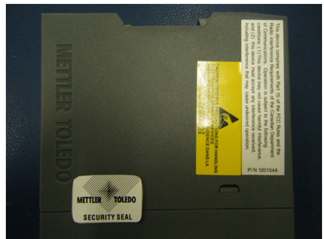
Typical sealing on housing / Scellage typique sur le boîtier