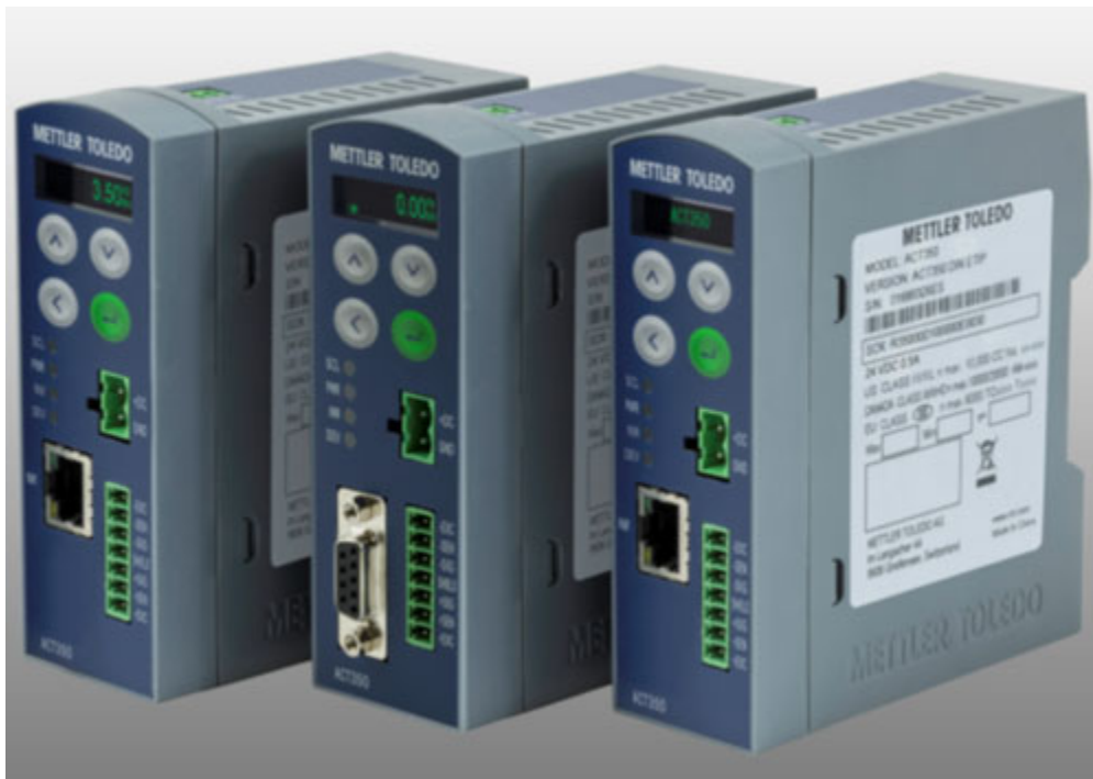
Typical device / Appareil typique