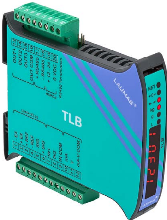
Typical device / Appareil typique