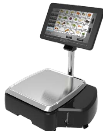
Typical model HTi-SSL$** or HTx-SSW$* / Modèle typique HTi-SSL$** ou HTx-SSW$*