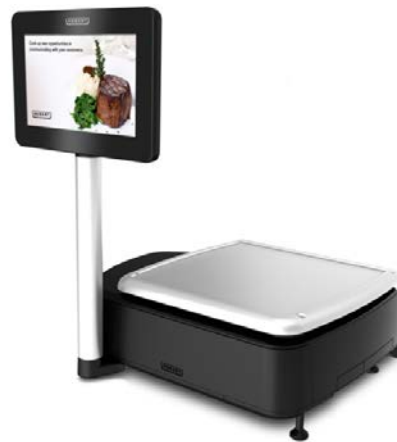
Typical model HTi-10EL$* or HTx-10EW$ / Modèle typique HTi-10EL$* ou HTx-10EW$