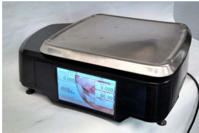
Typical model HTi-7L$, HTs-7L$, or HTx-7W$ / Modèle typique HTi-7L$, HTs-7L$, ou HTx-7W$