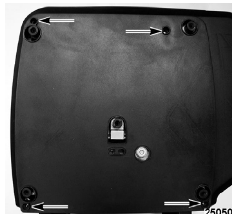
Typical HT Series Sub-Platter / Sous châssis typique de série HT