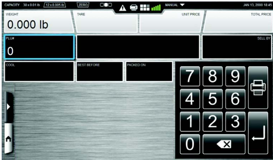
Typical Operator's Display / Afficheur typique destiné à l'opérateur