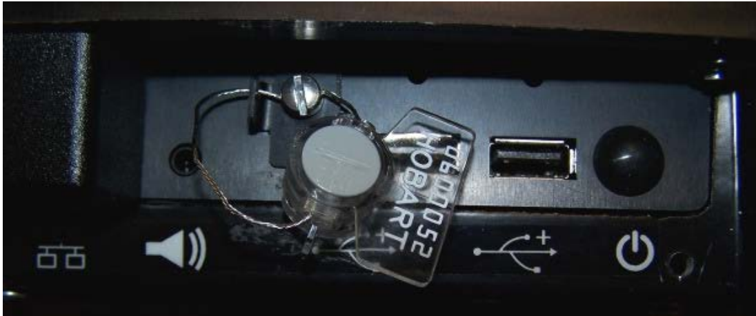
Typical Wire Sealing Method / Méthode typique de scellage avec fil d'acier