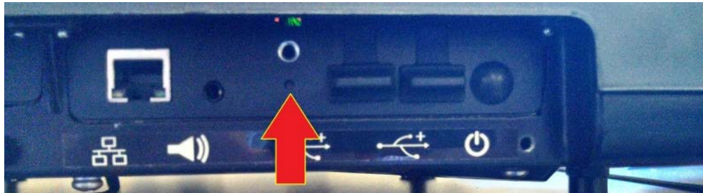
Typical Calibration Switch Location / Emplacement typique du bouton d'étalonnage