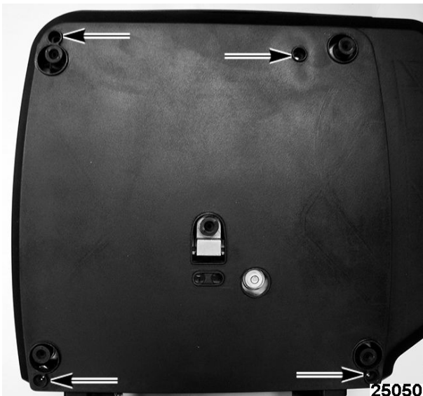
Typical HT Series Sub-Platter / Sous châssis typique de série HT