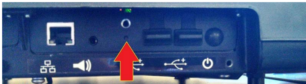
Typical Calibration Switch Location / Emplacement typique du bouton d'étalonnage