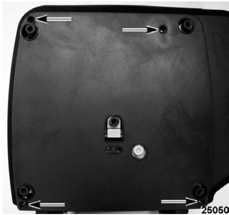
Typical HT Series Sub-Platter / Sous châssis typique de série HT