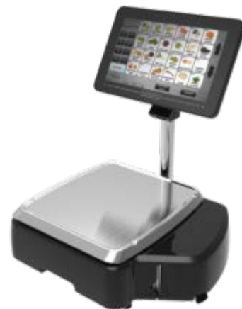
Typical model HTi-SSL$ or HTx-SSW$ / Modèle typique HTi-SSL$ ou HTx-SSW$