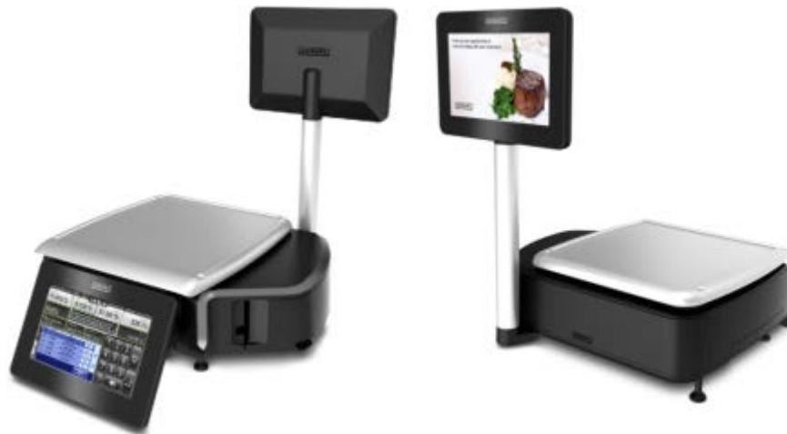
Typical model HTi-10EL$ or HTx-10EW$ / Modèle typique HTi-10EL$ ou HTx-10EW$