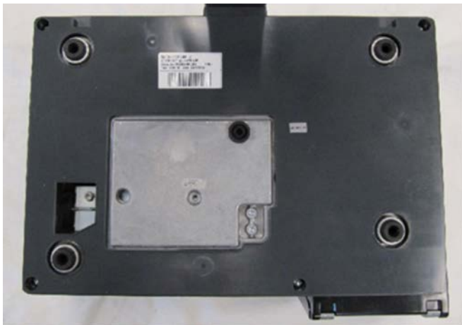
Typical subplatter / Sous-plateau typique