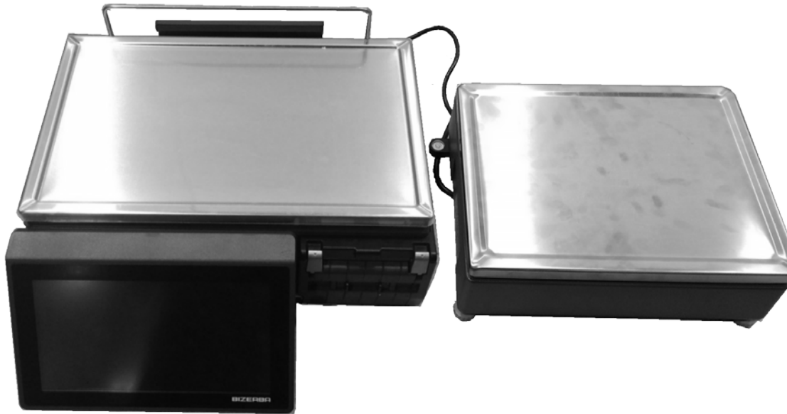
Typical model XC 100G / Modèle typique XC 100G