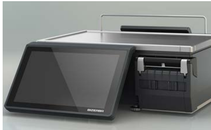
Typical model XC 100 / Modèle typique XC 100