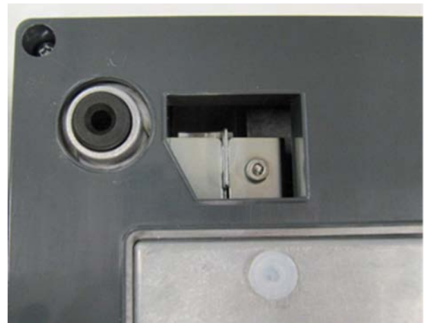
Sealing location / Location de sceau physique