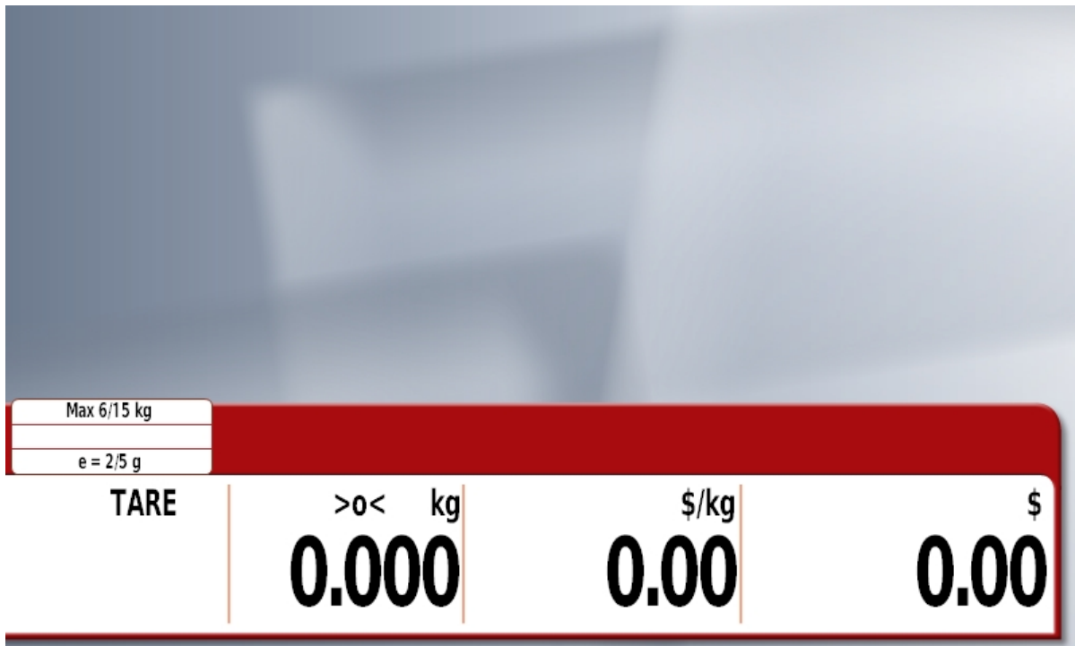
Typical customer's display / Affichage destiné aux clients typique