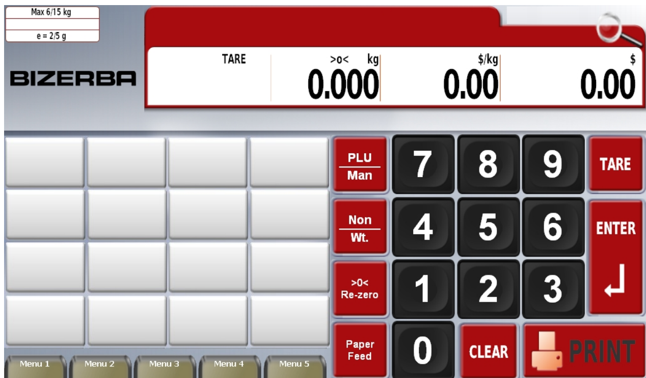
Typical operator's display / Affichage typique destiné à l'opérateur