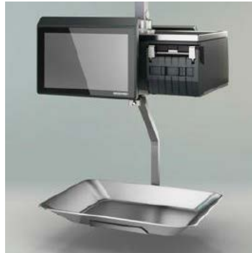
Typical model XC 400 / Modèle typique XC 400