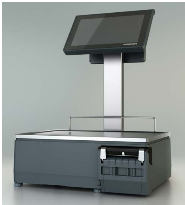
Typical model XC 800 / Modèle typique XC 800