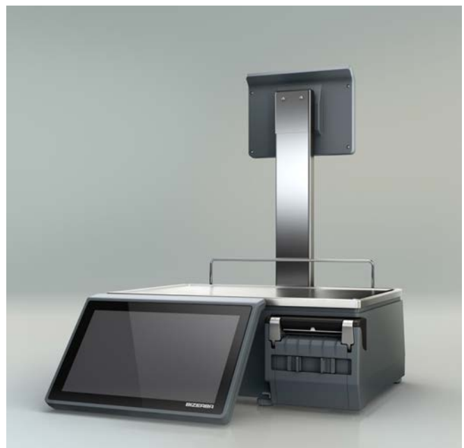
Typical model XC 100P / Modèle typique XC 100P