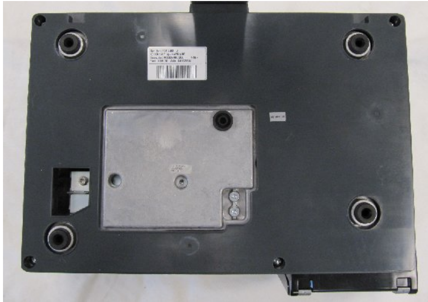
Typical subplatter / Sous-plateau typique