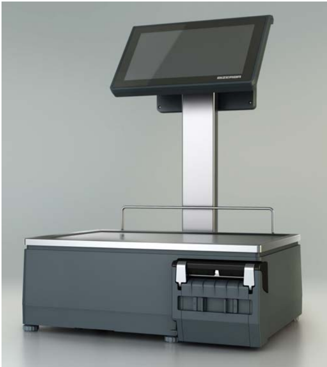
Typical mode XC 800 / Modèle typique XC 800