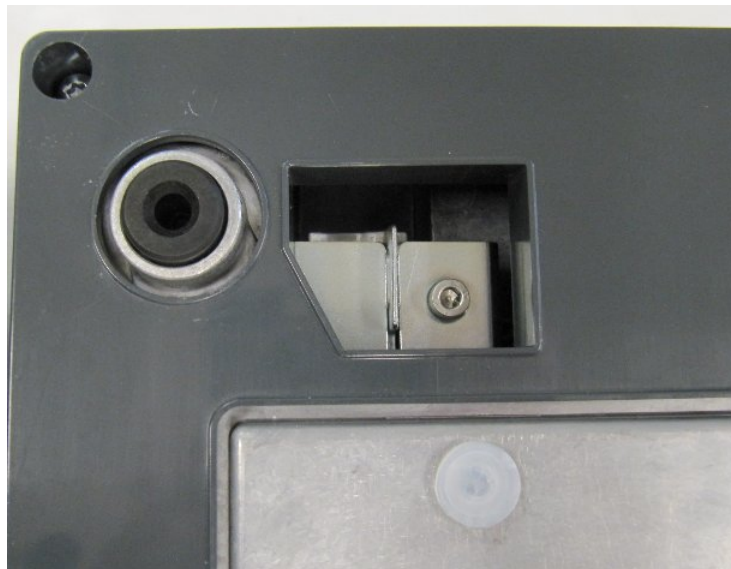
Sealing location / Location de sceau physique