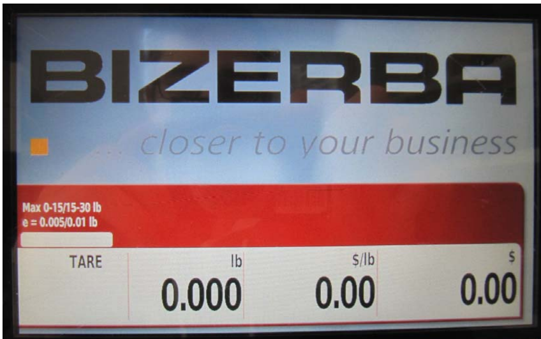
Typical customer's display / Affichage destiné aux clients typique