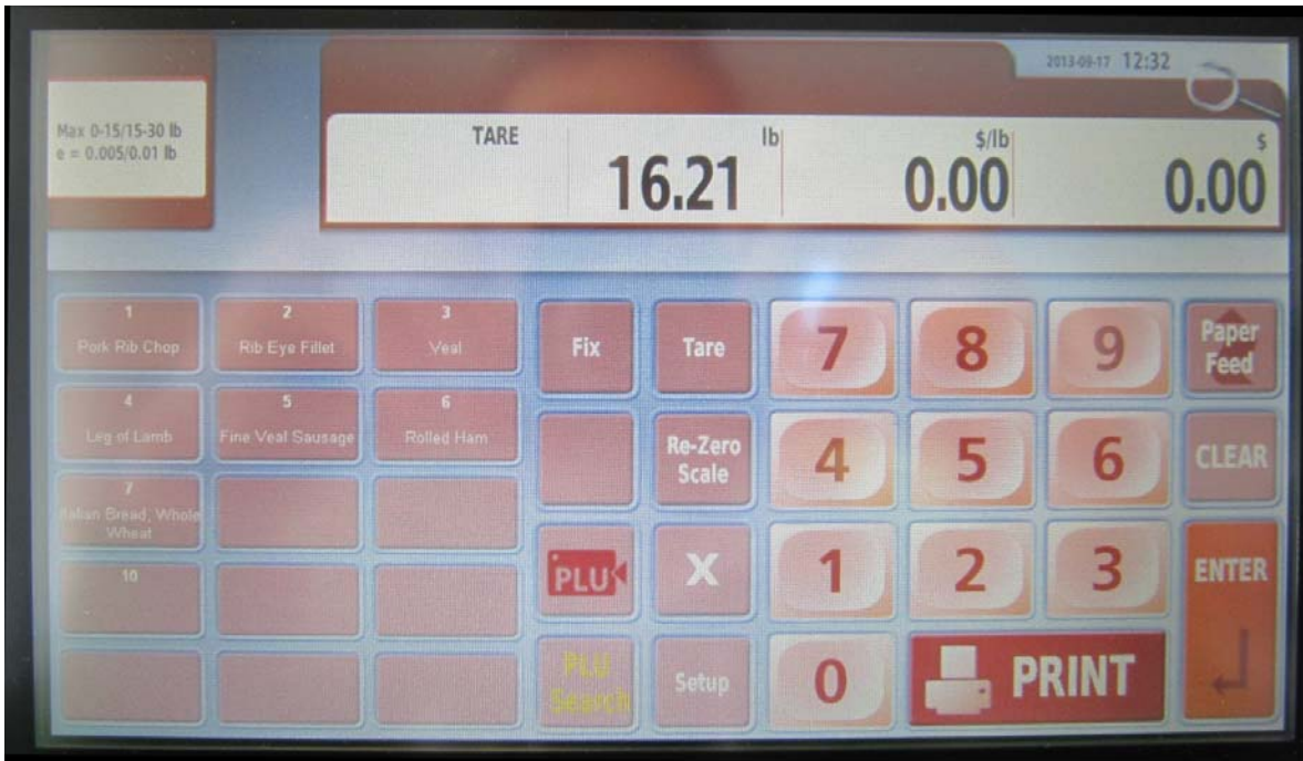
Typical operator's display / Affichage typique destiné à l'opérateur