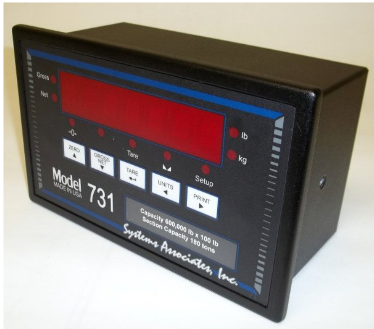
Typical model 731 / Modèle typique 731