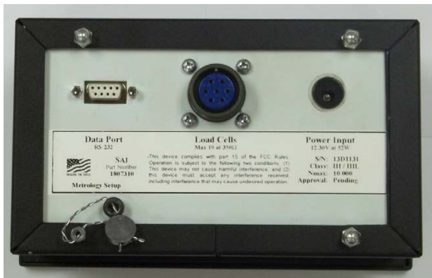
Typical sealing / Scellage typique