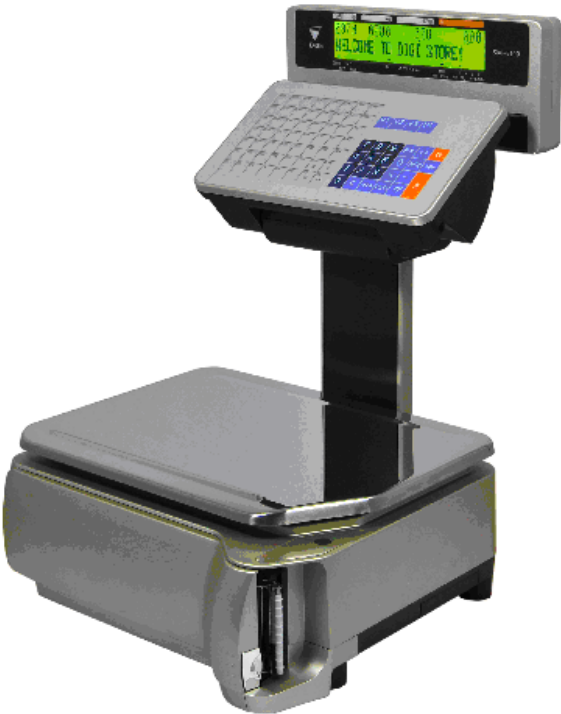
Typical model SM-5100EV / Modèle SM-5100EV typique