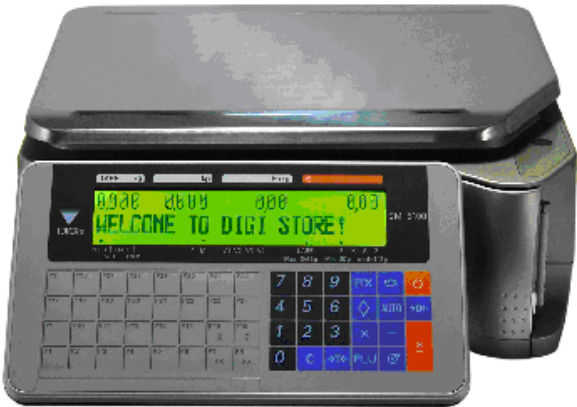
Typical model SM-5100B / Modèle SM-5100B typique