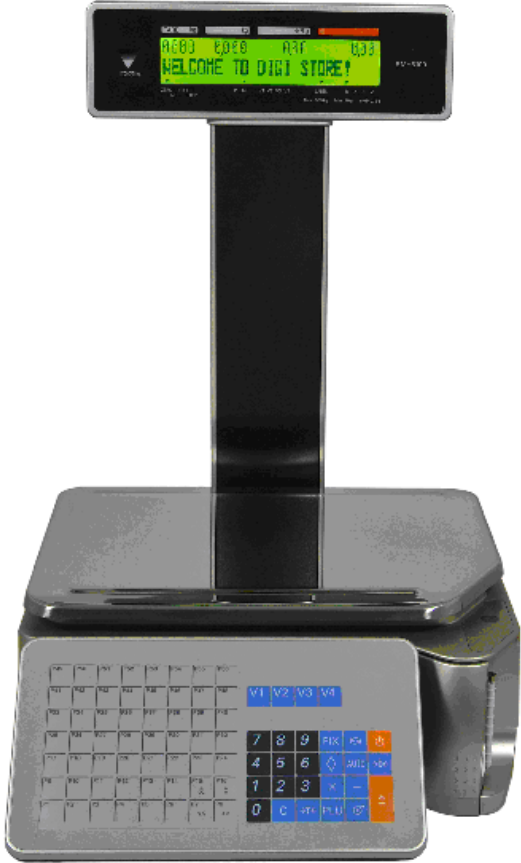
Typical model SM-5100P / Modèle SM-5100P typique