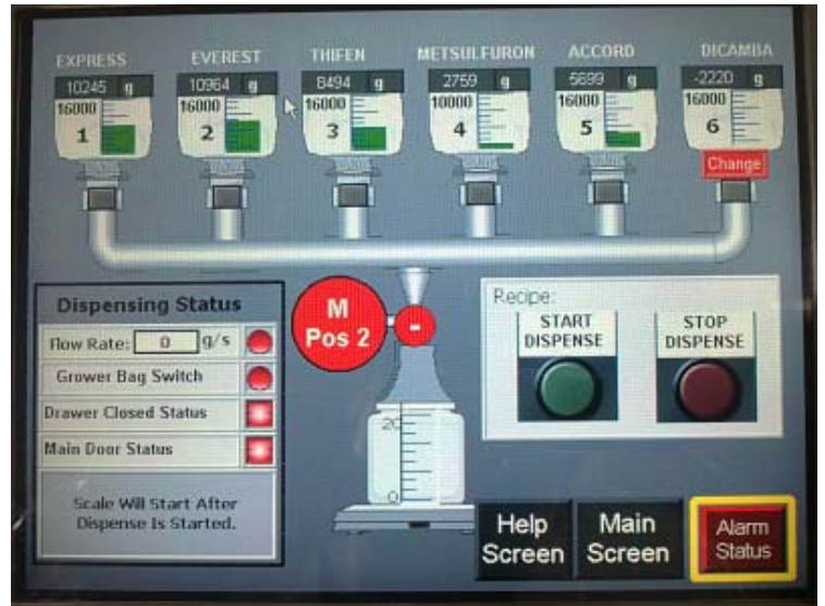
Dispensing screen / Écran de distribution