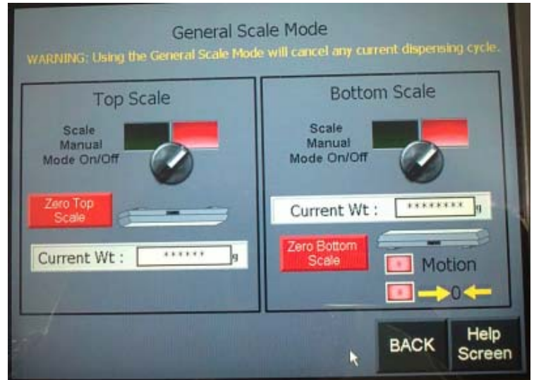
Master mode General Scale screen (0.5 g division) / Écran «General Scale» du mode maître (division 0.5 g)