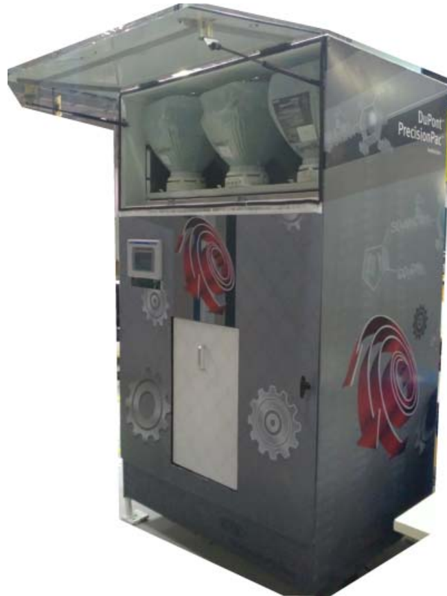
Typical model PrePac 2 / Modèle PrePac 2 typique