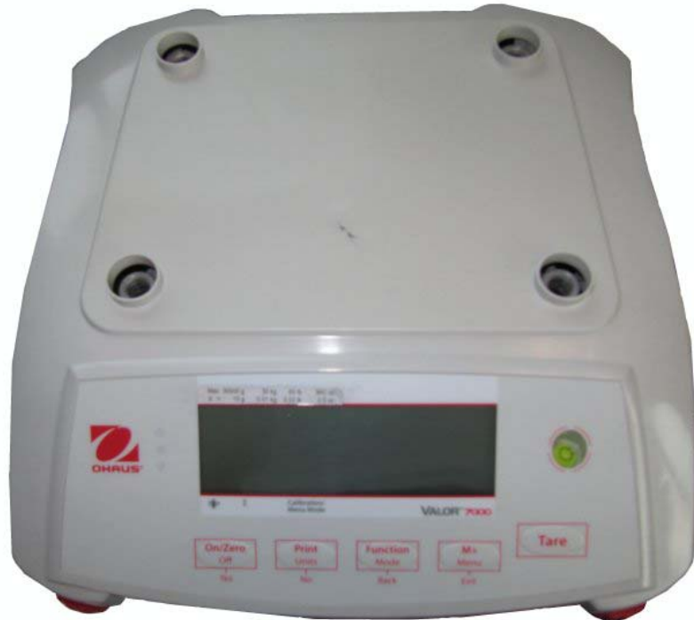
Typical sub-platter / Sous-plateau typique