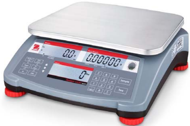
Typical model RC31P*** / Modèle RC31P*** typique