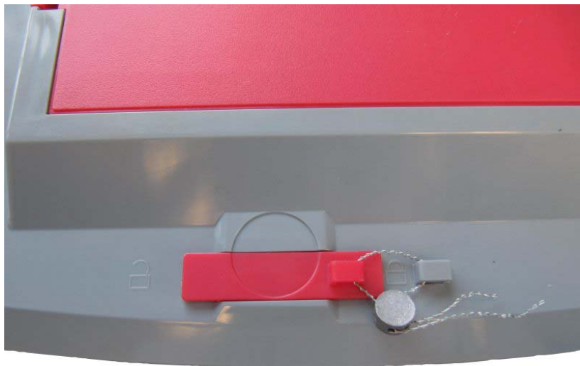
Typical physical seal / Sceau physique typique