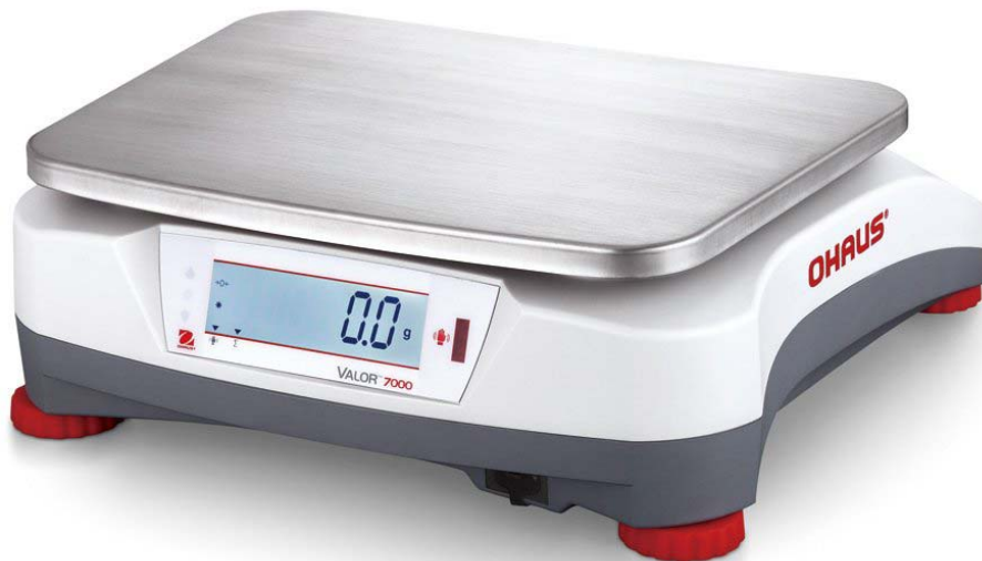
Typical V71P****T customer's display / Affichage destiné aux clients typique du modèle V71P****T