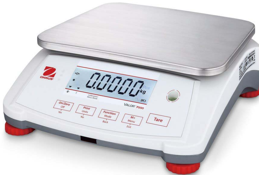
Typical model V71P****T / Modèle V71P****T typique