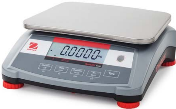
Typical models R31P*** / Modèle R31P*** typique