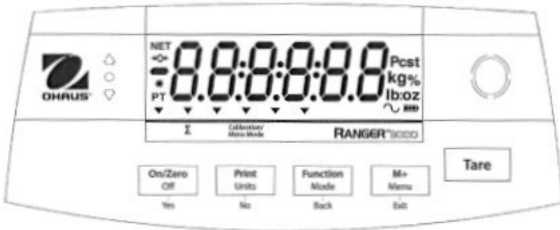
Typical R31P*** display and keys / Affichage et touches typique de la modèle R31P***