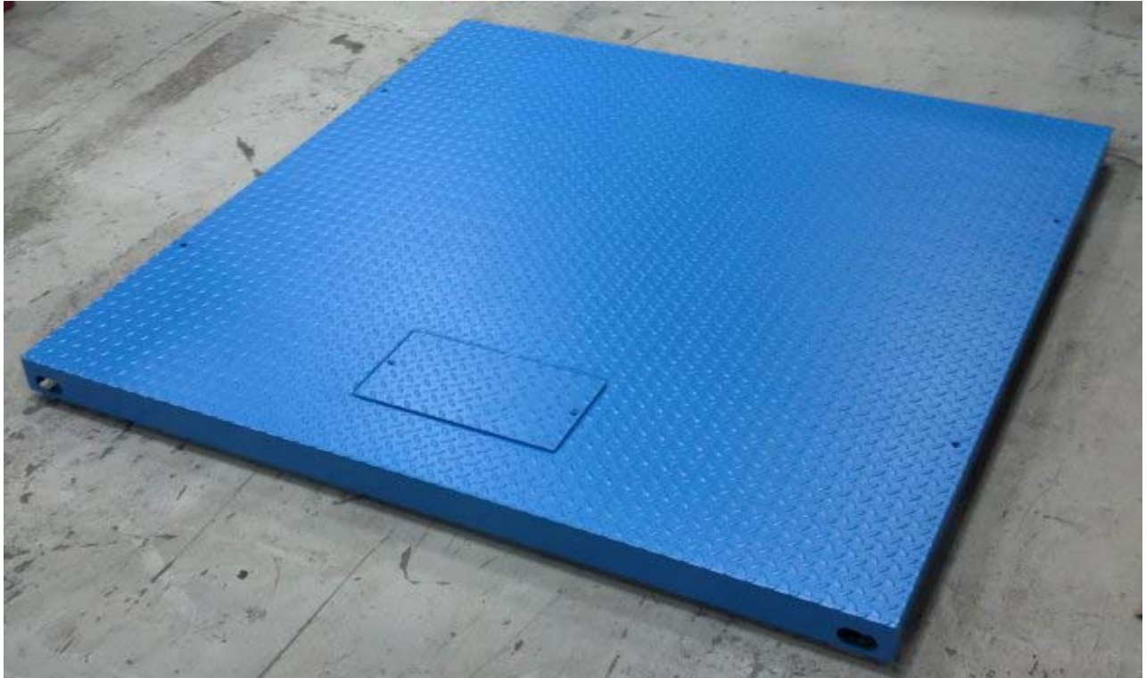
Typical model DSLXXYY-ZZ / Modèle DSLXXYY-ZZ typique