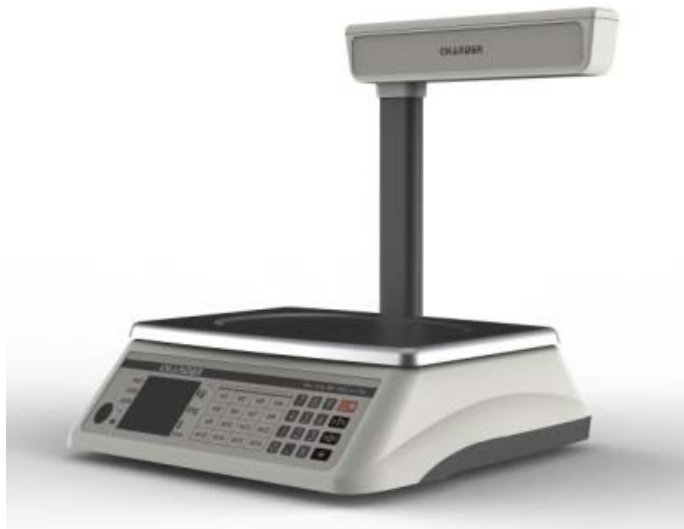
Typical model PC-2400 with pole mounted customer's display / Modèle PC-2400 typique avec affichage destiné aux clients monté sur colonne