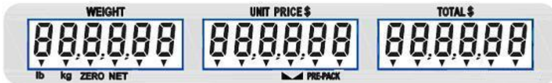
Typical customer's display for models D15, D30 and D60 / Affichage typique destiné aux clients des modèles D15, D30 et D60