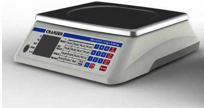
Typical model D15, D30 or D60 / Modèle typique de D15, D30 ou D60