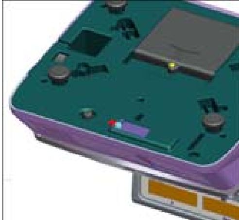
Typical location of seal / Emplacement typique du scellé