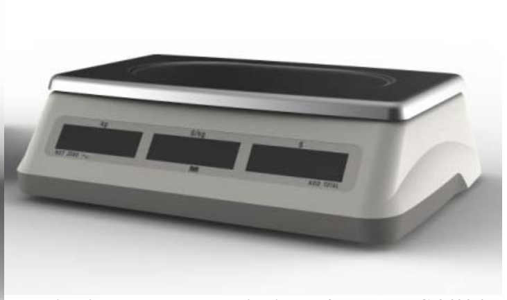
Typical integrated customer's display for model PC-2400 / Affichage intégré typique destiné aux clients du modèle PC-2400