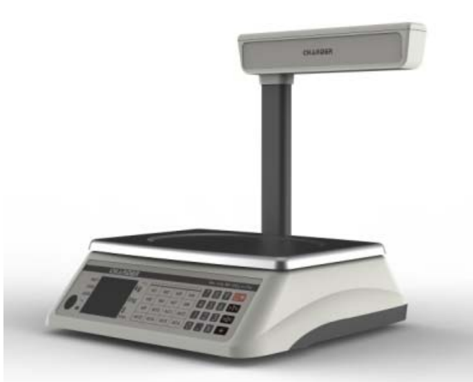
Typical model PC-2400 with pole mounted customer's display / Modèle PC-2400 typique avec affichage destiné aux clients monté sur colonne