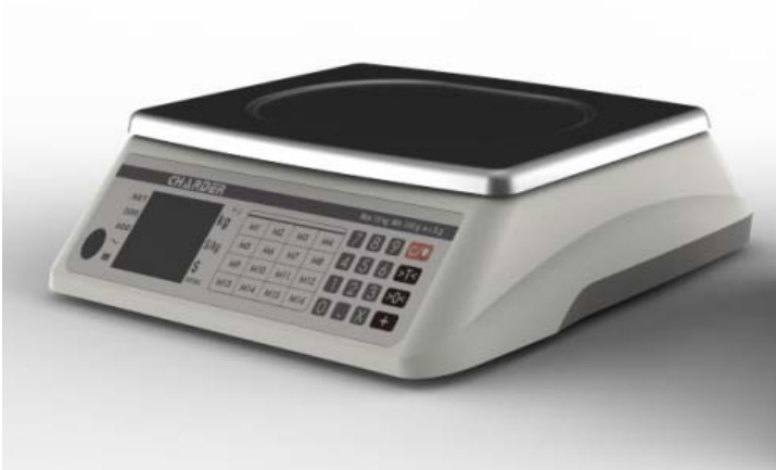
Typical model PC-2400 with integrated customer's display / Modèle PC-2400 typique avec affichage destiné aux clients intégré