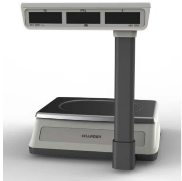
Typical pole mounted customer's display for model PC-2400 / Affichage monté sur colonne typique destiné aux clients du modèle PC-2400