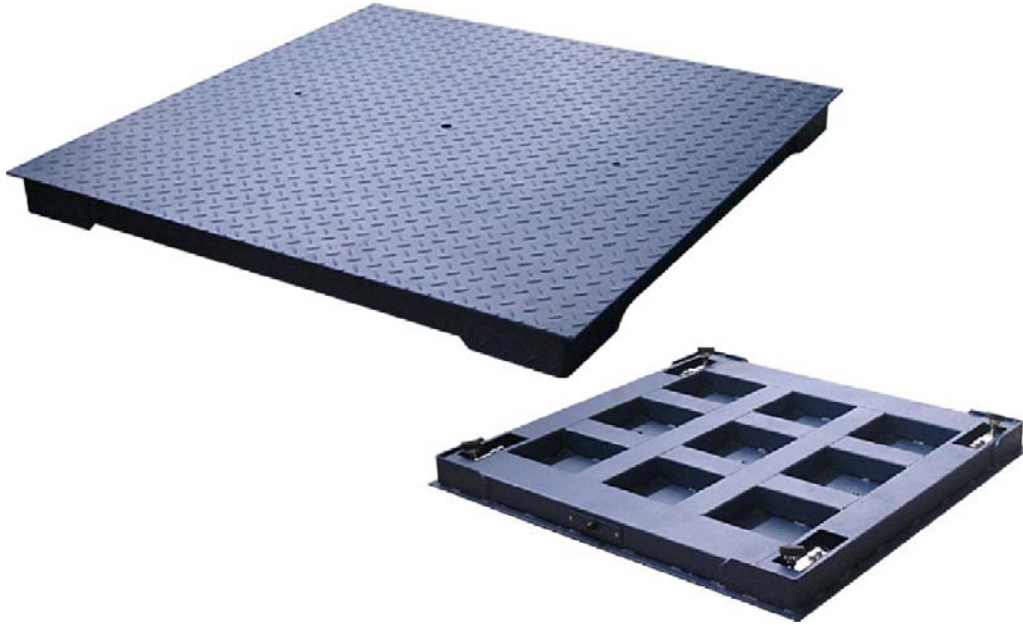
Typical Modele / Modèle typique BU-4x4-5 MS