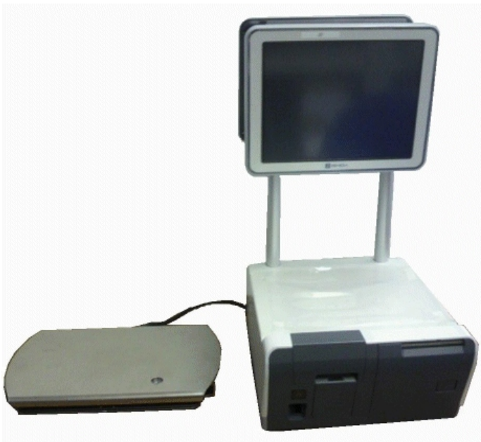
Typical UNI-9 EV with remote weighing element / Modèle UNI-9 EV typique avec élément récepteur de charge.