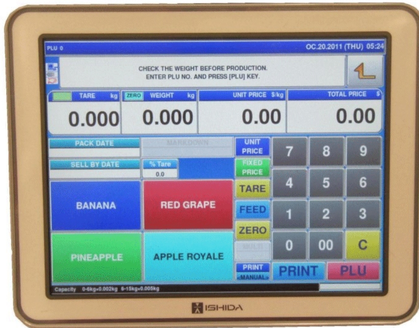
Typical operator's display / Affichage typique destiné à l'opérateur