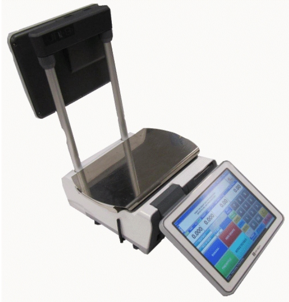
Typical model UNI-9 P with long pole / Modèle UNI-9 P typique avec un long poteau