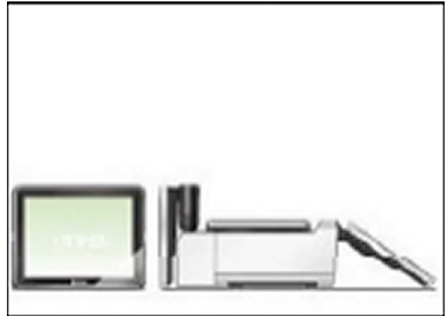
Typical model UNI-9 P with short pole / Modèle UNI-9 P typique avec un poteau court.