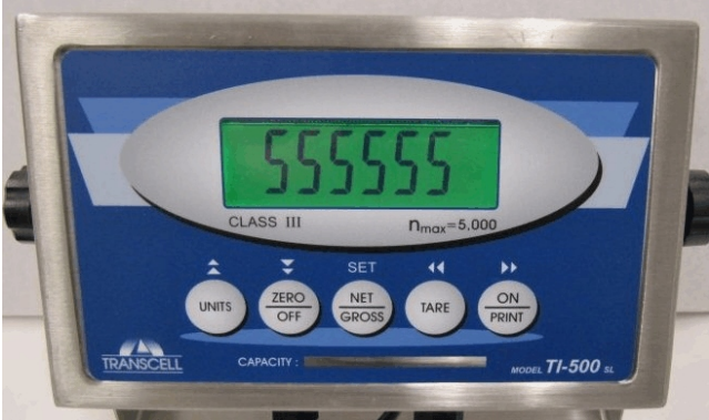
Typical Model TI-500 SL / Modèle typique TI-500 SL