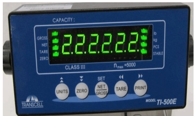
Typical Model TI-500E / Modèle typique TI-500E