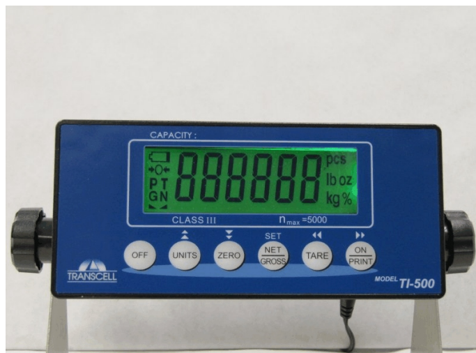
Typical Model TI-500 / Modèle typique TI-500