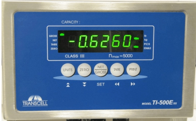
Typical Model TI-500E SS / Modèle typique TI-500E SS