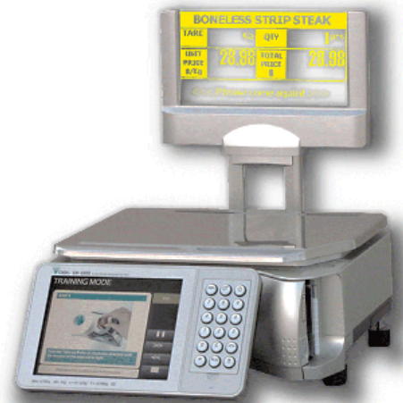
Typical model SM-5500P EL Audit Trail / Modèle SM-5500P EL Audit Trail typique