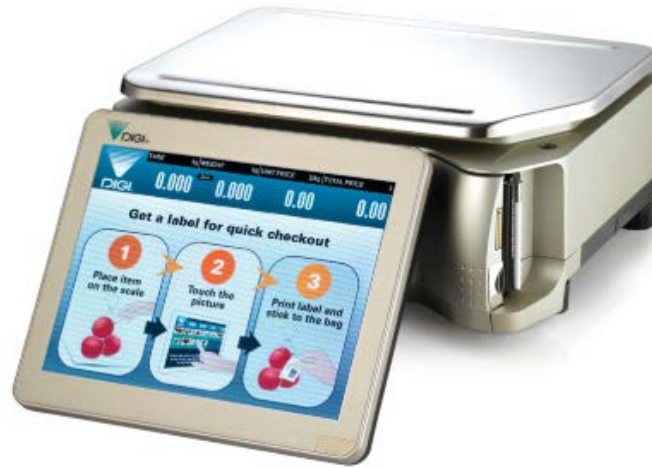
Typical model SM-5500BS Audit Trail / Modèle SM-5500BS Audit Trail typique