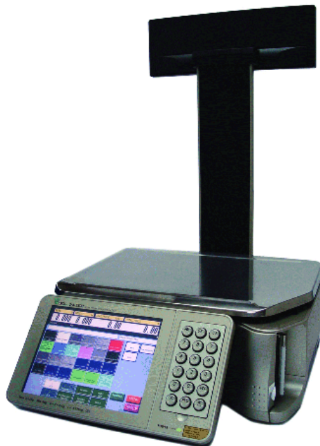
Typical model SM-5500P Audit Trail / Modèle SM-5500P Audit Trail typique