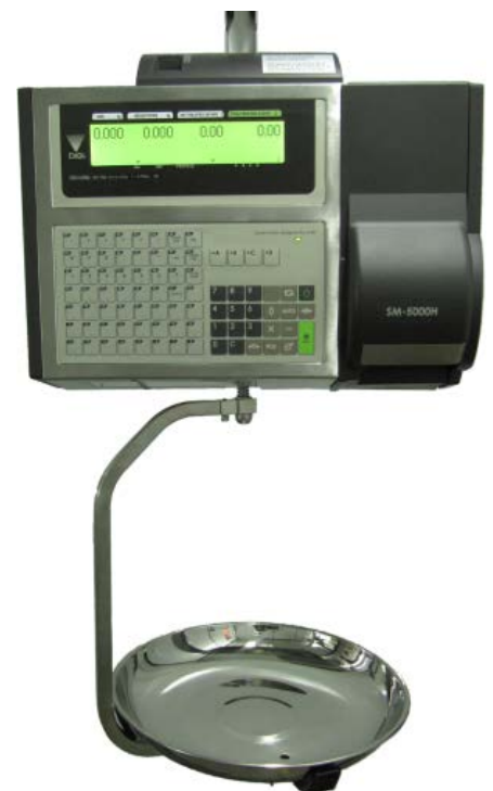
Typical model SM-5000H Audit Trail / Modèle SM-5000H Audit Trail typique