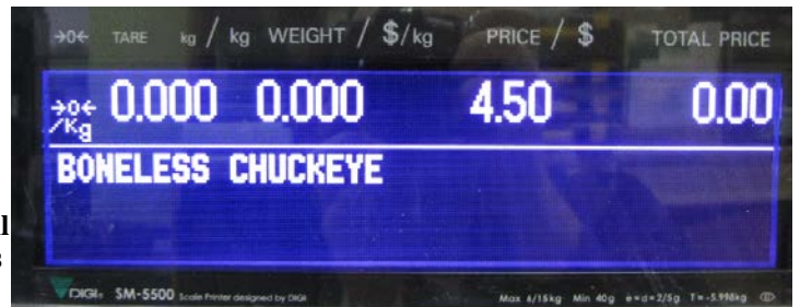
Typical customers' display for SM-5500 Audit Trail series models / Affichage destiné aux clients typique des modèles du series SM-5500 Audit Trail