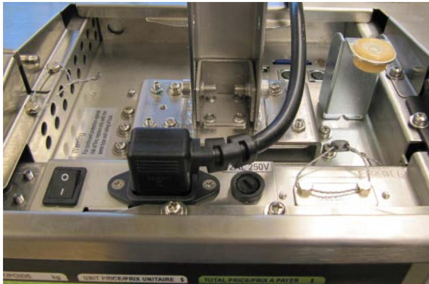
Typical housing and calibration switch seals of model SM-5000H Audit Trail / Scellés typiques du boîtier et de l'interrupteur d'étalonnage du modèle SM-5000H Audit Trail