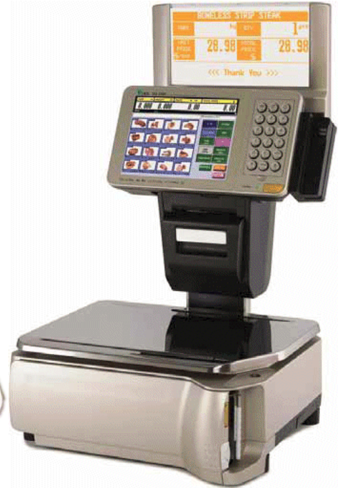
Typical model SM-5500EV EL Audit Trail / Modèle SM-5500EV EL Audit Trail typique