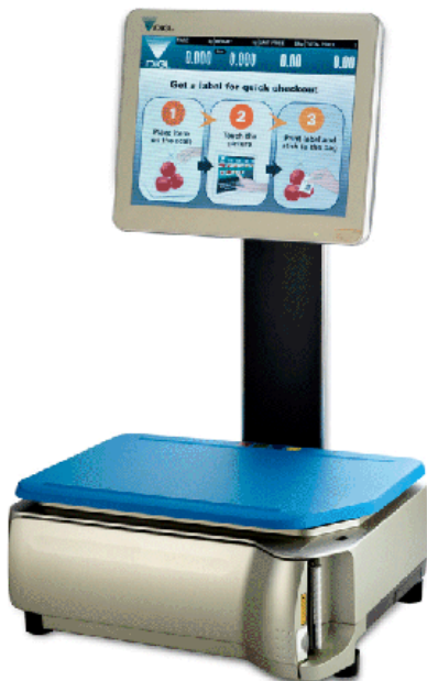
Typical models SM-5000BS Audit Trail, SM-5600BS Audit Trail and SM-5600BS Camera Audit Trail / Modèles SM- 5000BS Audit Trail, SM-5600BS Audit Trail et SM-5600BS Camera Audit Trail typiques