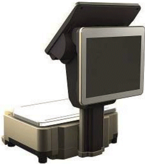
Typical customers' display of models SM-5500EV Plus Audit Trail, SM-5600EV Plus Audit Trail, SM5500P Plus Audit Trail and SM-5600P Plus Audit Trail / Affichage destiné aux clients typique des modèles SM-5500EV Plus Audit Trail, SM-5600EV Plus Audit Trail, SM-5500P Plus Audit Trail et SM-5600P Plus Audit Trail