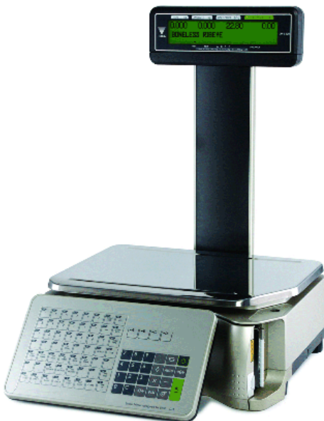
Typical model SM-5400P Audit Trail / Modèle SM-5400P Audit Trail typique