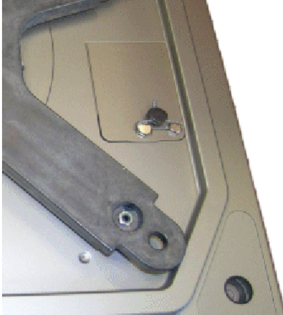
Typical calibration switch seal for all approved models except for model SM-5000H Audit Trail / Scellé typique de l'interrupteur d'étalonnage de tous les modèles à l'exception du modèle SM-5000H Audit Trail