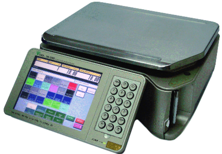
Typical model SM-5500B Audit Trail / Modèle SM-5500B Audit Trail typique