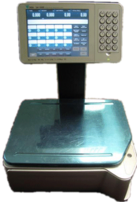
Typical model SM-5500EV Audit Trail / Modèle SM-5500EV Audit Trail typique