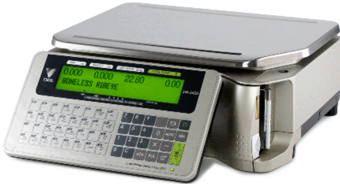
Typical model SM-5400B Audit Trail / Modèle SM-5400B Audit Trail typique