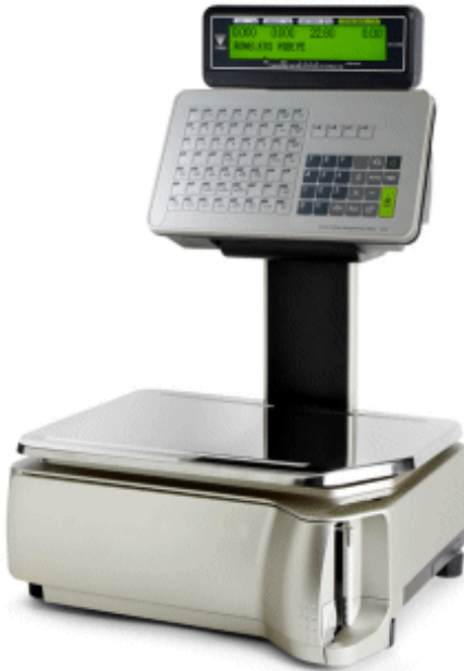
Typical model SM-5400EV Audit Trail / Modèle SM-5400EV Audit Trail typique