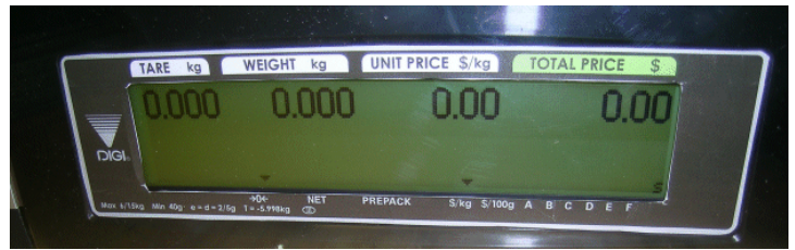
Typical customers' display for SM-5400 Audit Trail series models and SM-5000H Audit Trail / Affichage destiné aux clients typique des modèles du series SM-5400 Audit Trail et SM-5000H Audit Trail