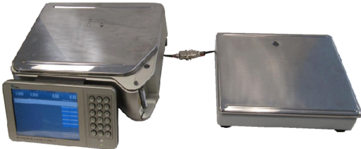
Typical model SM-5500 Split Audit Trail / Modèle SM-5500 Split Audit Trail typique