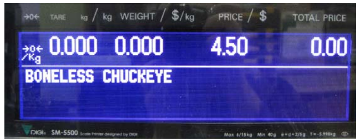
Typical customers' display for models SM-5500## / Affichage destiné aux clients typique des modèles SM-5500##