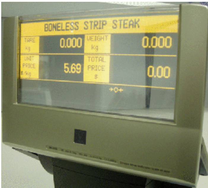
Typical customers' display of models SM-5500P EL and SM-5500EV EL / Affichage destiné aux clients typique des modèles SM-5500P EL et SM-5500EV EL