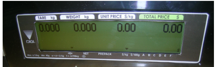
Typical customers' display for models SM-5400## and SM-5000H / Affichage destiné aux clients typique des modèles SM-5400## et SM-5000H