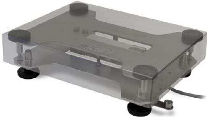
Typical sub-platter (2.5 kg and 5 kg capacities) / Sous-plateau typique (2.5 kg et 5 kg capacités)