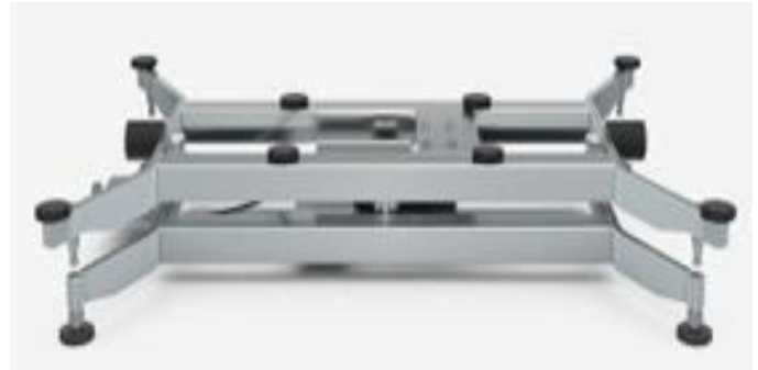
Typical sub-platter (500 kg capacity) / Sous-plateau typique (500 kg capacité)