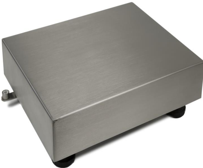
Typical Model PBA226-yynnn / Modèle typique PBA226-yynnn