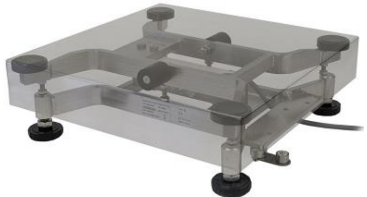
Typical sub-platter (10 kg, 25 kg, 50 kg and 100 kg capacities) / Sous-plateau typique (10 kg, 25 kg, 50 kg et 100 kg capacités)