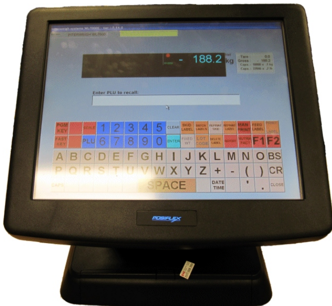
Typical WL-7000S-LE model / Modèle WL-7000S-LE typique