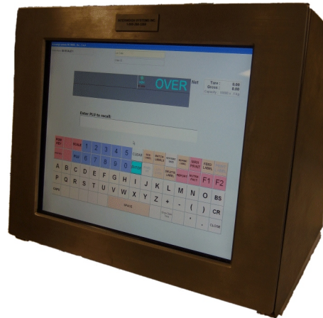
Typical WL-7000S model / Modèle WL-7000S typique