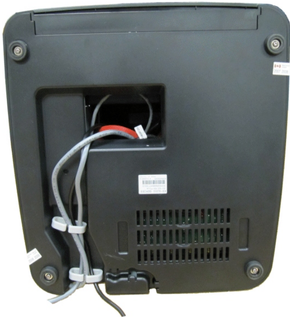
Typical bottom seals for model WL-7000S-LE / Scellés du dessous typique du modèle WL-7000S-LE