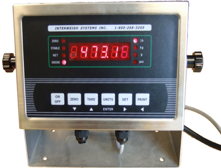
Typical ISI-799 model / Modèle ISI-799 typique