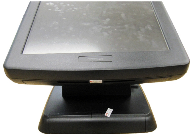
Typical hard drive and communication ports cover seals for model WL-7000S-LE / Scellés des courvercles du disque dur et des ports de communications typiques du modèle WL-7000S-LE