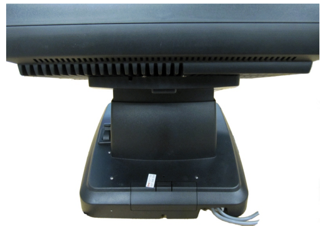
Typical rear seal for WL-7000S-LE model / Scellé arrière typique pour le modèle WL-7000S-LE